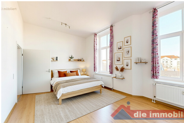
Schlafzimmer mit KI möbliert