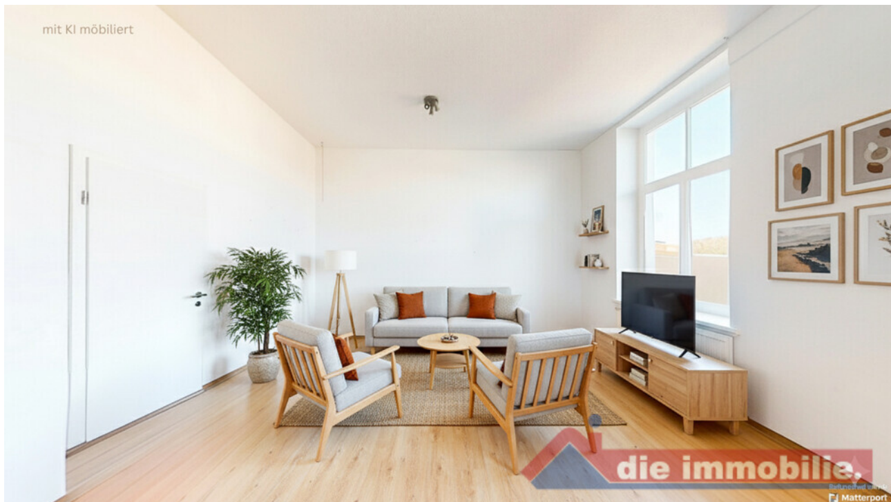
Wohnzimmer mit KI möbliert