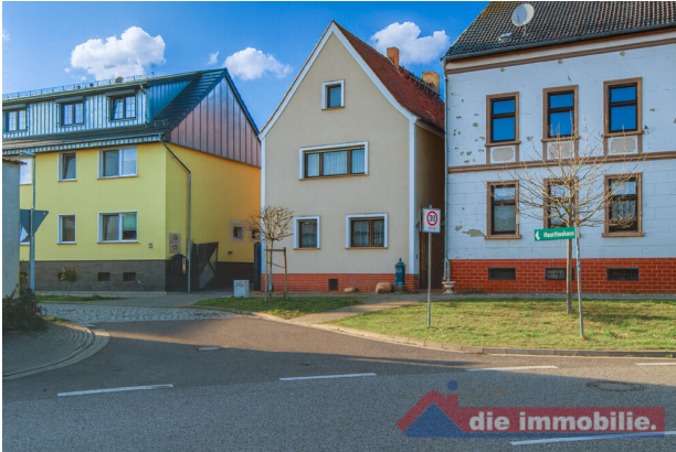
Blick von der Straße