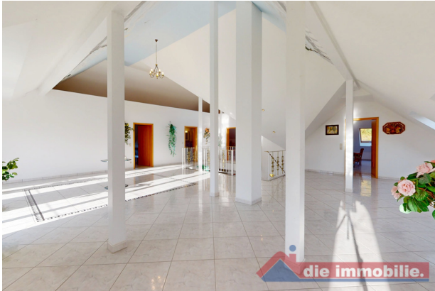
Lichtdurchflutetes Obergeschoss mit Blick ins Atrium