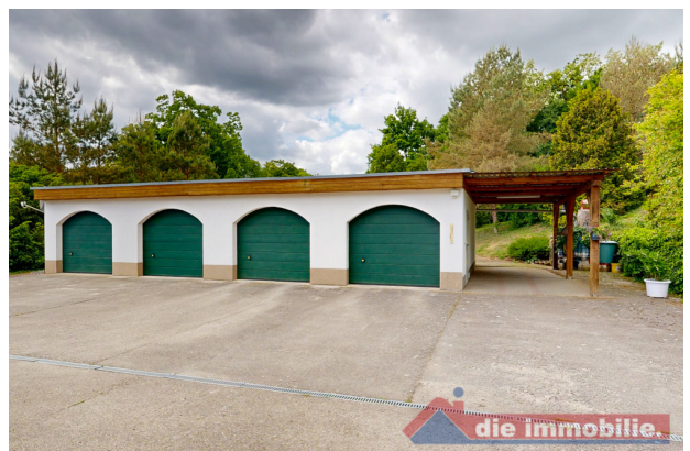
Vierfach-Garage – auch für Sammler oder Unternehmer ideal