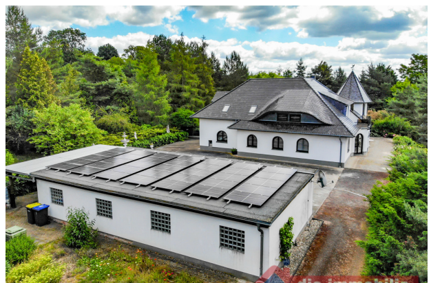
Zeitlose Architektur trifft moderne Technik