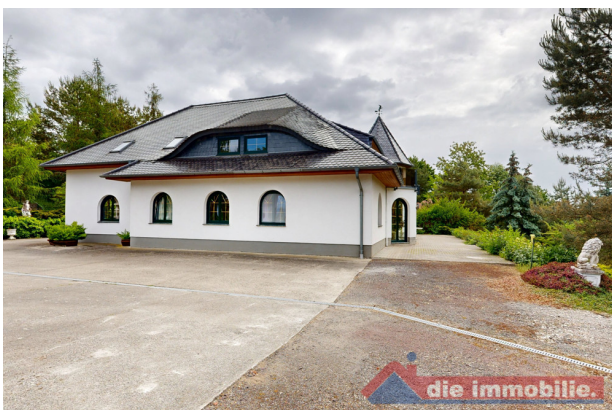
Charaktervolle Fassade mit markanten Rundbogenfenstern umgeben von gepflegtem Grün