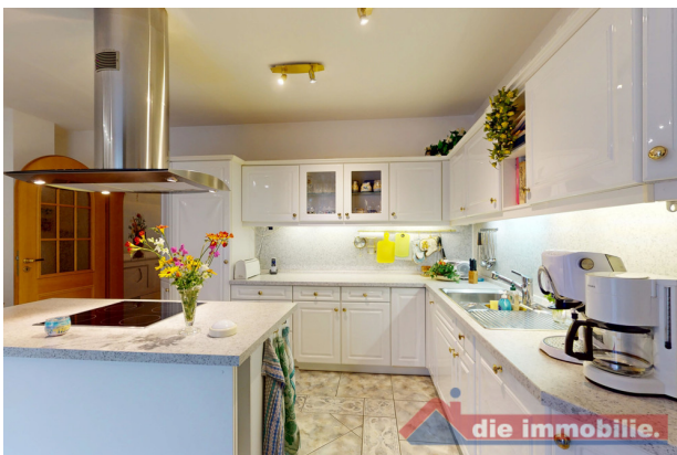
Voll ausgestattete Wohnküche mit Kochinsel, hochwertigen Fronten, Cerankochfeld und viel Stauraum.