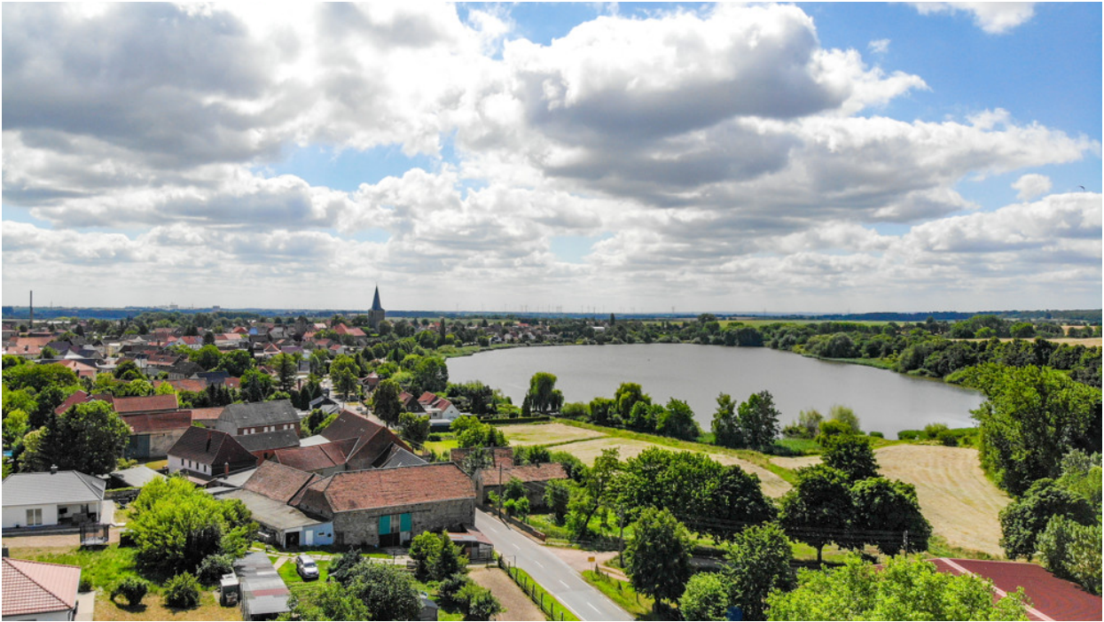
Blick vom Aussichtsturm: Naturpanorama und stilvolle Architektur vereint