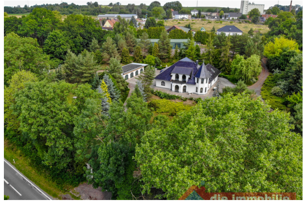
Ihr eigenes Reich im Grünen – ein einzigartiges Anwesen, eingebettet in Natur, Raum und Ruhe