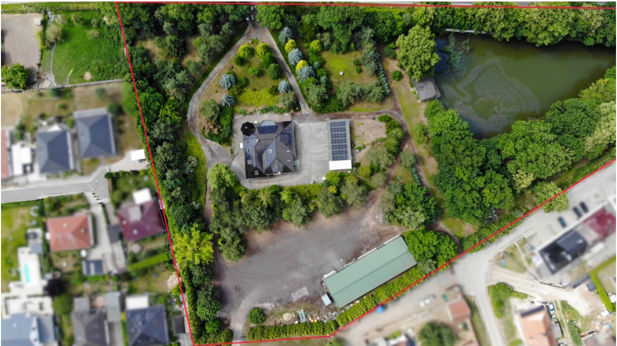
Luftaufnahme der Villa – eingebettet in weite Parklandschaft