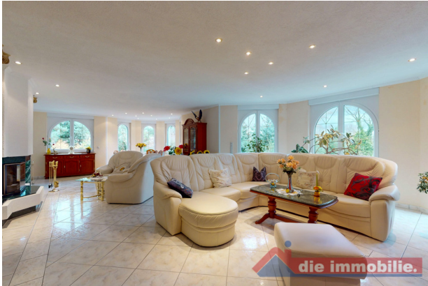
Wohnzimmer mit Kamin – Rückzugsort mit Ausblick ins Grüne