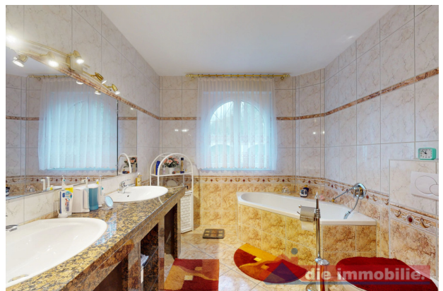
Eines von drei Bädern – mit großer Eckwanne, Doppelwaschplatz und warmen Naturtönen.