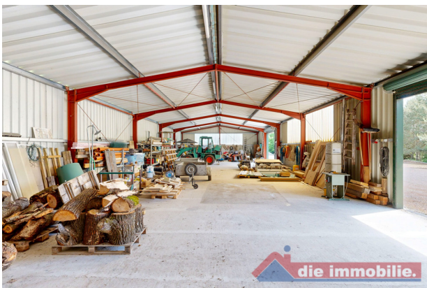
300m 2 Lagerhalle