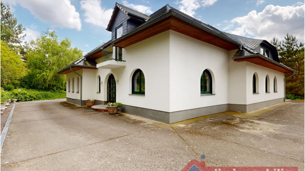
architektonische Symmetrie mit Stil.