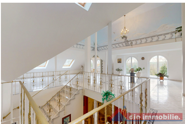
Repräsentatives Atrium mit Marmortreppe