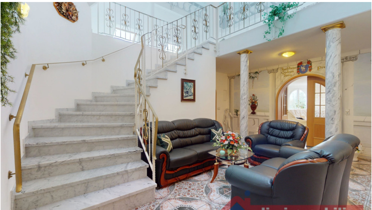
Mediterranes Ambiente – das lichtdurchflutete Atrium mit Marmortreppe