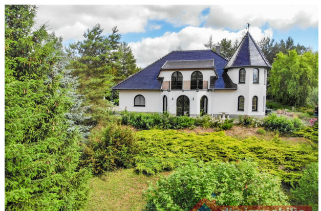
Villa auf sanftem Hügel