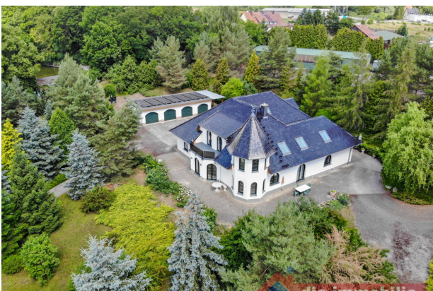
Repräsentatives Anwesen auf ca. 20.000 m 2