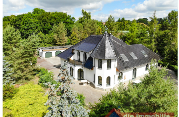
Villa - klassizistisch inspiriert mit mediterranen Elementen