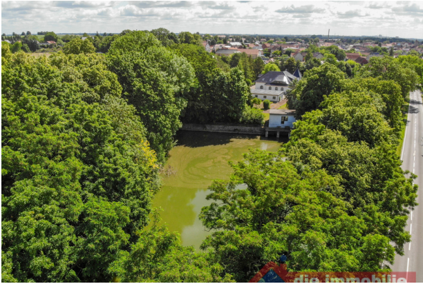
Private Badeanstalt mit Gartenhaus – Ruheoase direkt vor der Haustür