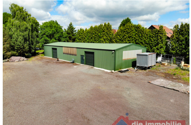
Großzügiger Zufahrtsbereich zur Lagerhalle