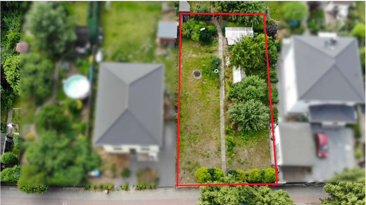
eingebettet in attraktive Stadtvillen