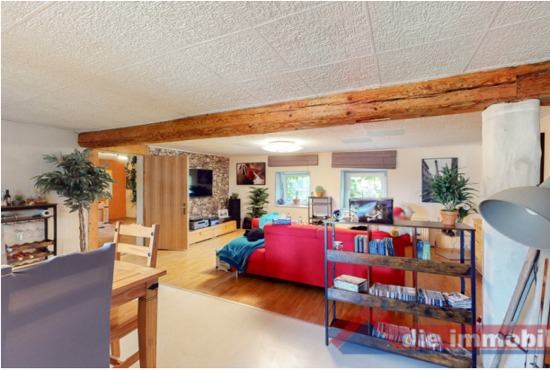
Wohnzimmer 2 OG_2