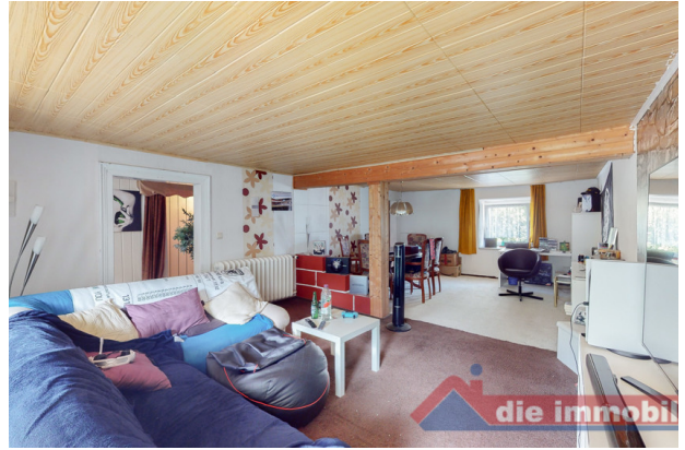
Wohnzimmer 1 OG_2