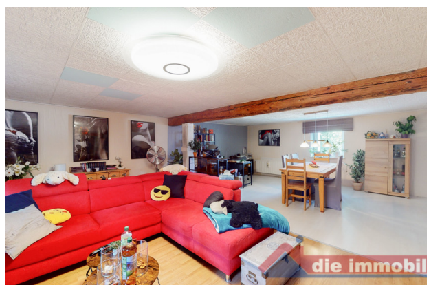
Wohnzimmer 2 OG_1