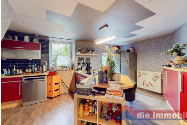
Küche 2 EG_1