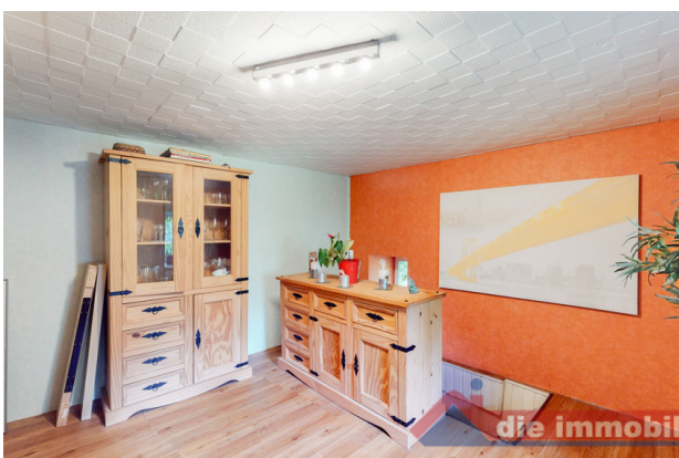
Flur 2 OG