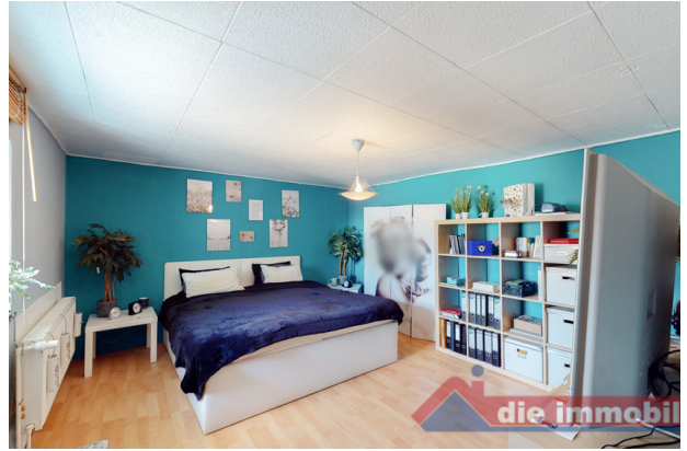
Schlafzimmer 2 OG