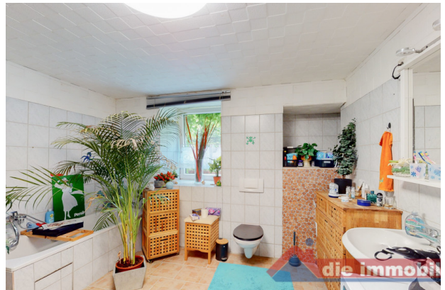
Bad 2 EG_2