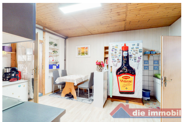
Küche 1 EG