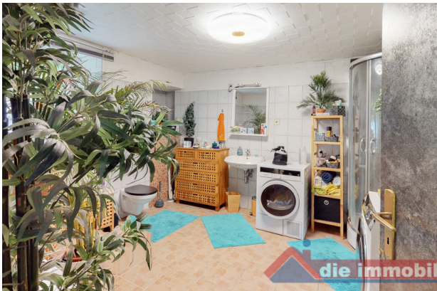
Bad 2 EG_1