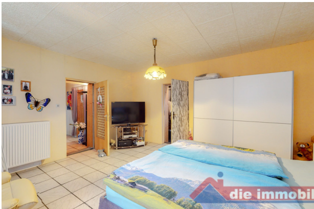
Schlafzimmer 1 EG