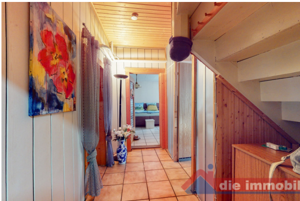
Flur 2 EG