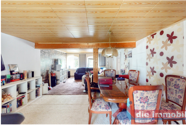
Wohnzimmer 1 OG_1