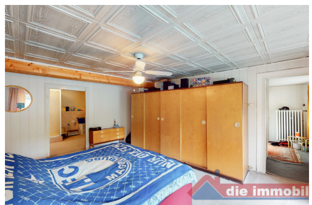
Schlafzimmer 1 OG