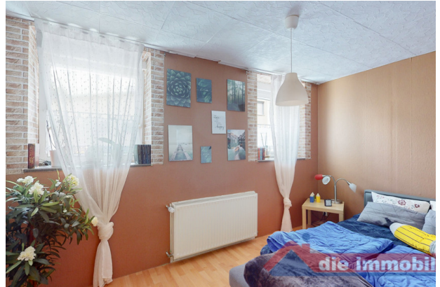
Schlafzimmer 2 EG