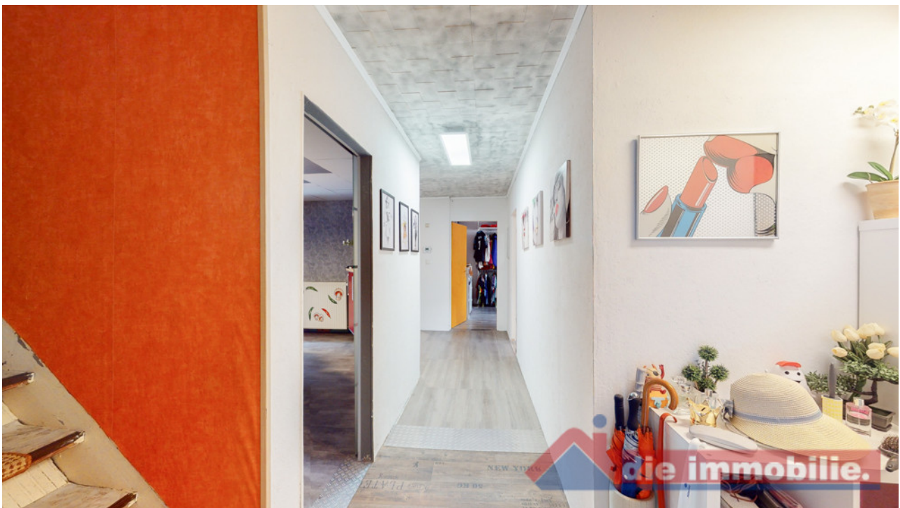
Flur 3 EG_1