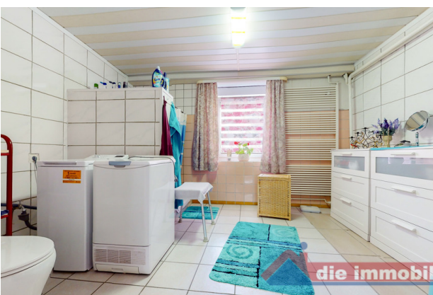
Bad 1 EG