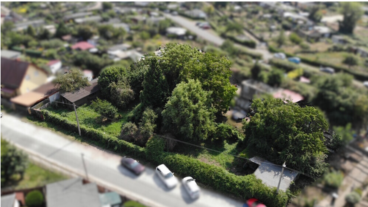
Platz für kreative Gartengestaltung und Freizeitideen