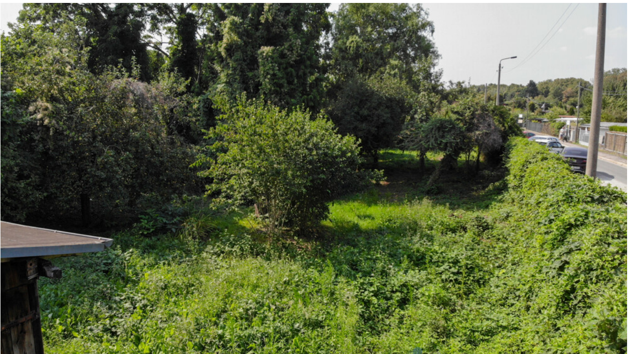
Bestehender Obstbaumbestand – sofortige grüne Wohlfühl-Oase