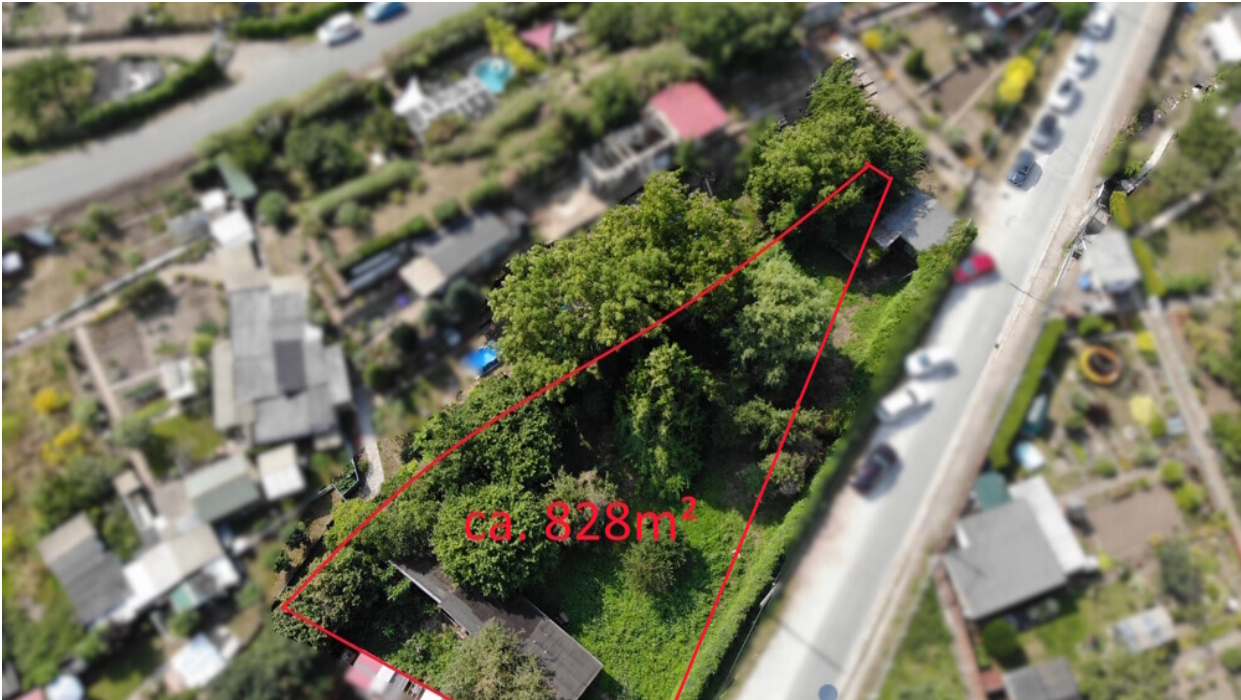
Blick auf das Grundstück – großzügige Fläche für Ihr zukünftiges Zuhause