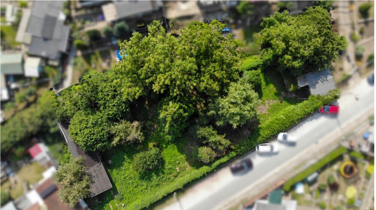
Idyllische Lage mit viel Ruhe und Privatsphäre