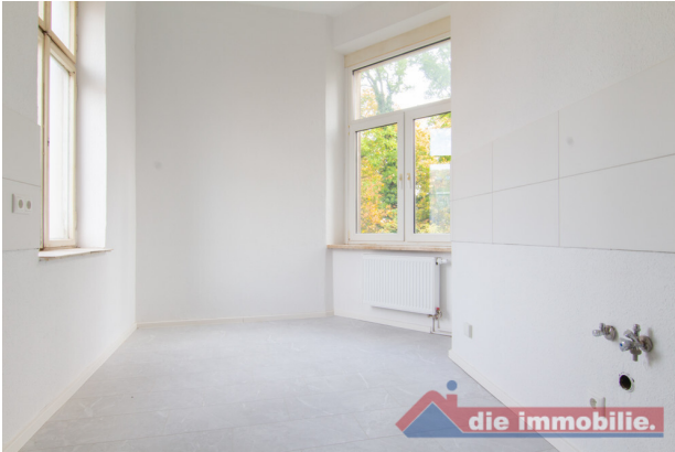
Küche_1- HH_2.OG rechts