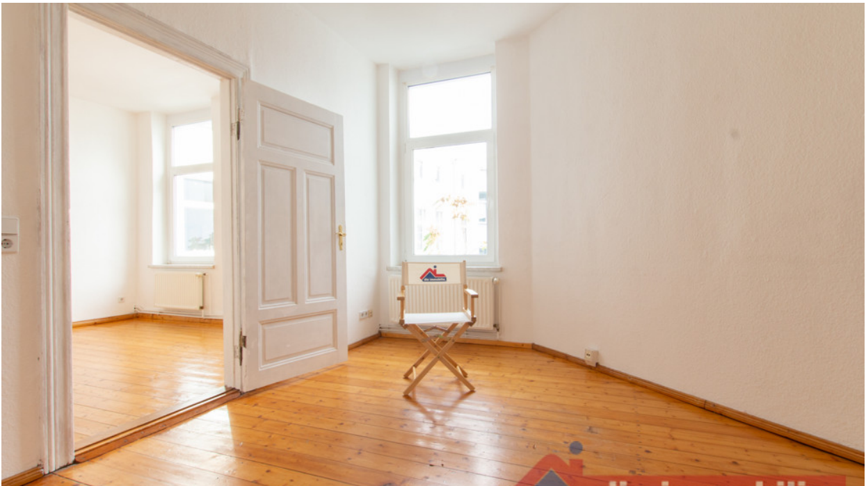
Schlafzimmer_1 - HH_3.OG links