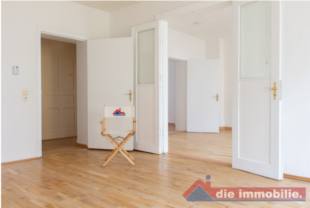
Wohnzimmer_3 - VH_2.OG