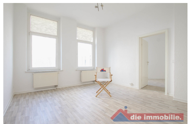
Wohnzimmer_1- HH_2.OG links