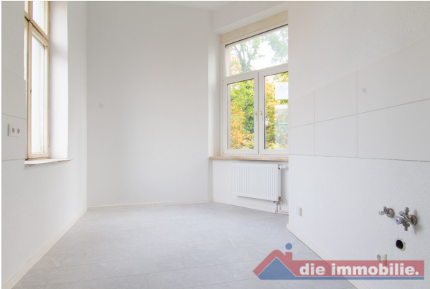
Küche_1- HH_2.OG rechts