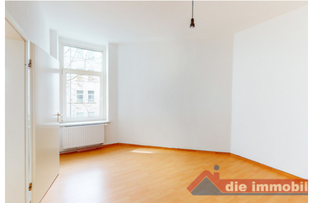
Schlafzimmer_2 - HH_1.OG links