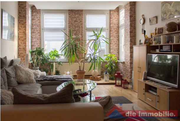
Wohnzimmer - VH_2.OG