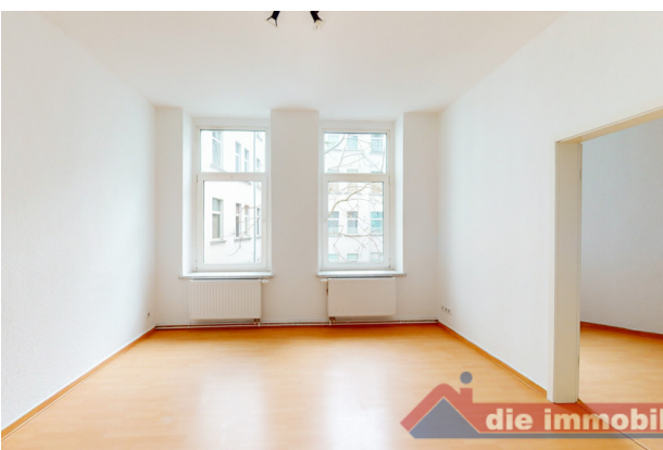
Wohnzimmer_1- HH_1.OG links