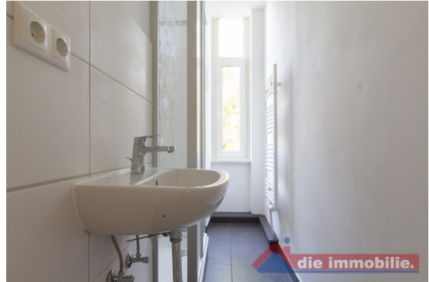
Bad_1- HH_2.OG rechts