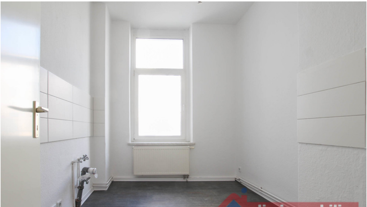
Küche_1- HH_2.OG links