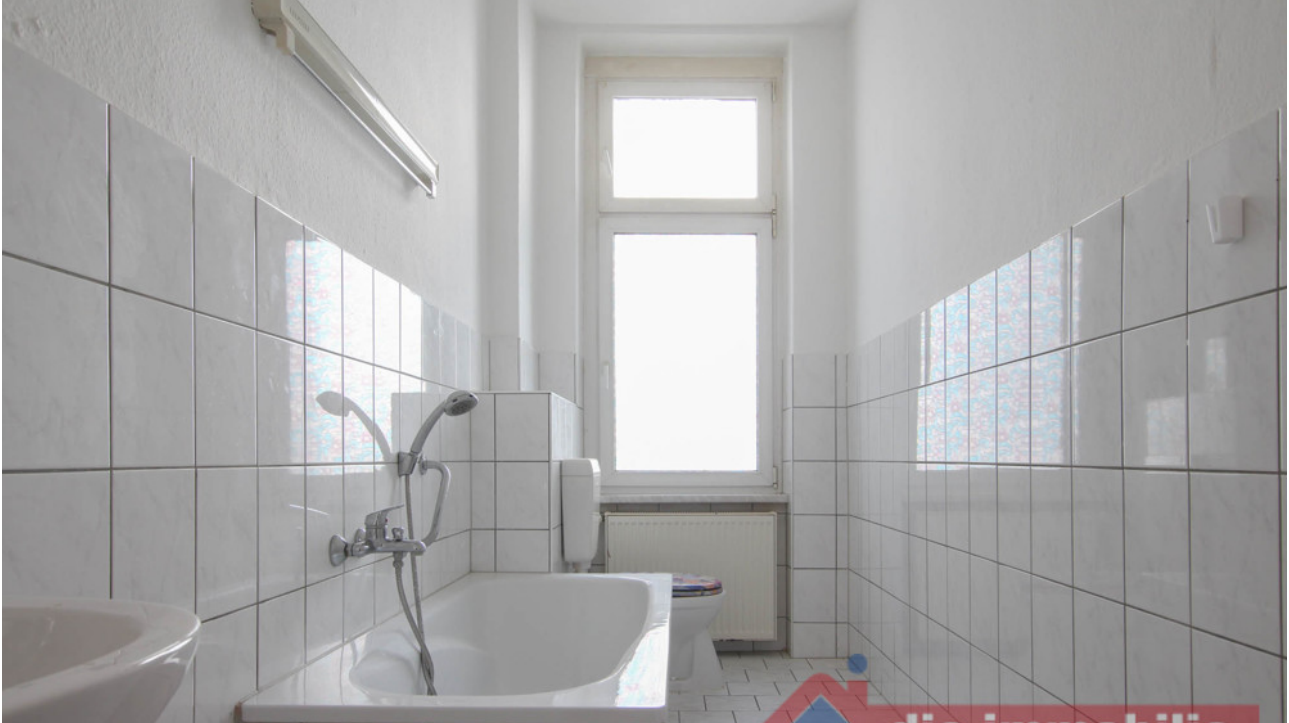
Badezimmer_1_1 - VH_2.OG