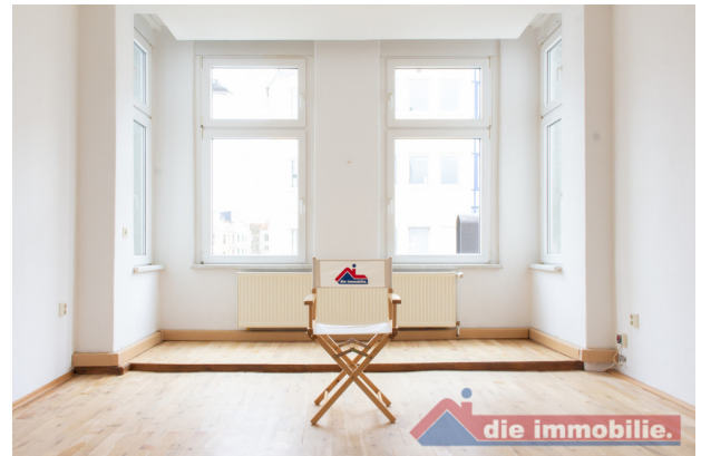
Wohnzimmer_1 - VH_2.OG