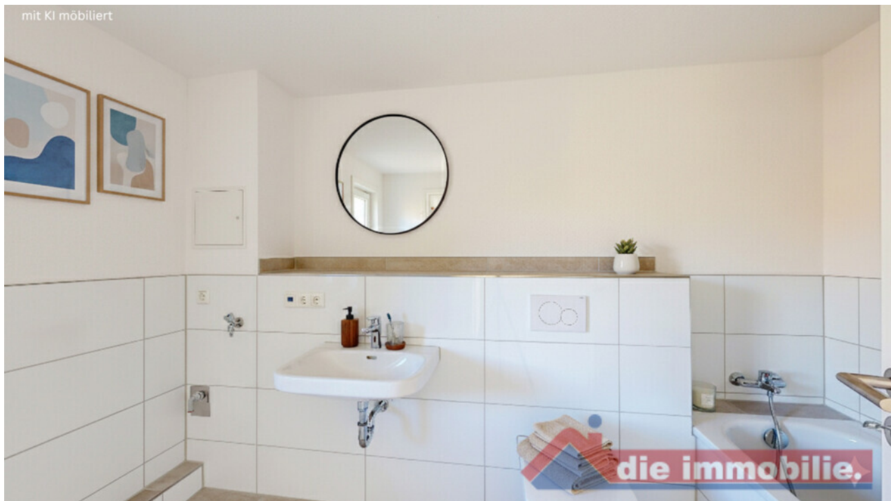
Bad mit KI möbliert