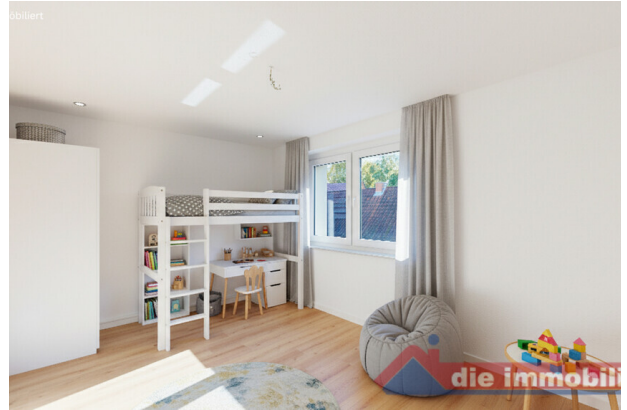
Kinderzimmer mit KI möbliert