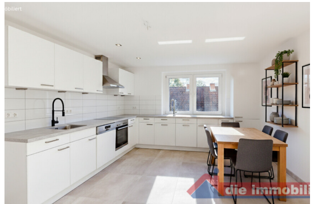
Küche mit KI möbliert