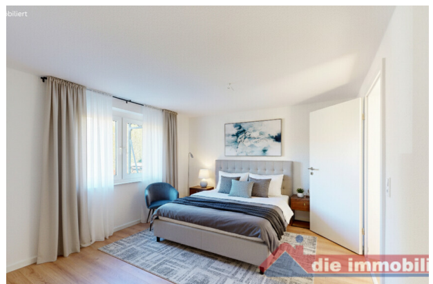
Schlafzimmer mit KI möbliert