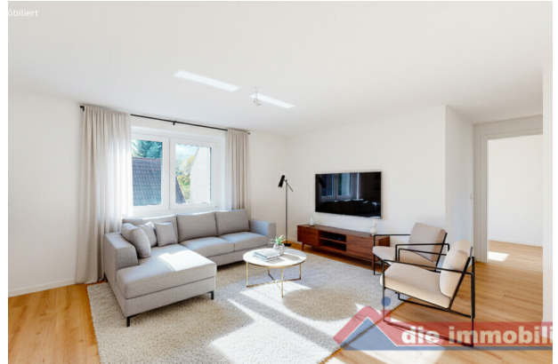
Wohnzimmer mit KI möbliert