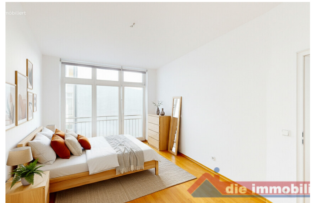
Schlafzimmer mit KI möbliert