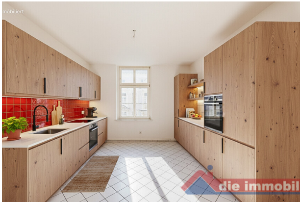
Küche mit KI möbliert