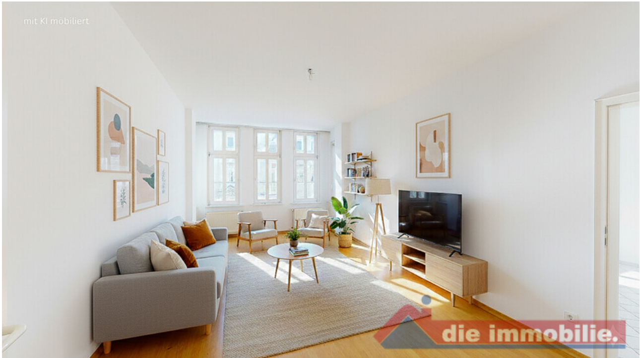
Wohnzimmer mit KI möbliert