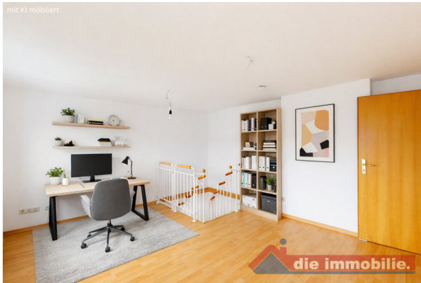
Arbeitszimmer mit KI möbliert