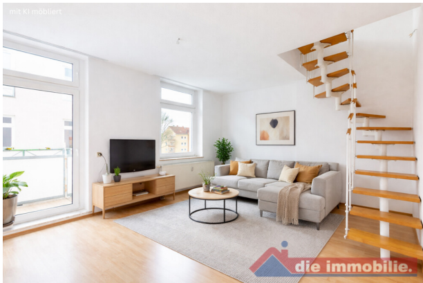
Wohnzimmer mit KI möbliert