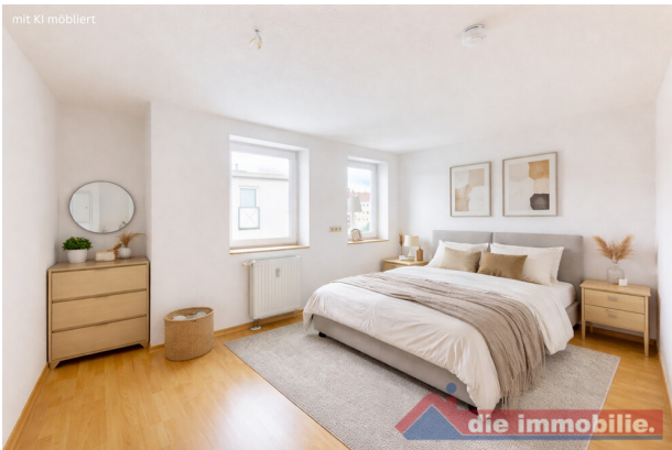
Schlafzimmer mit KI möbliert