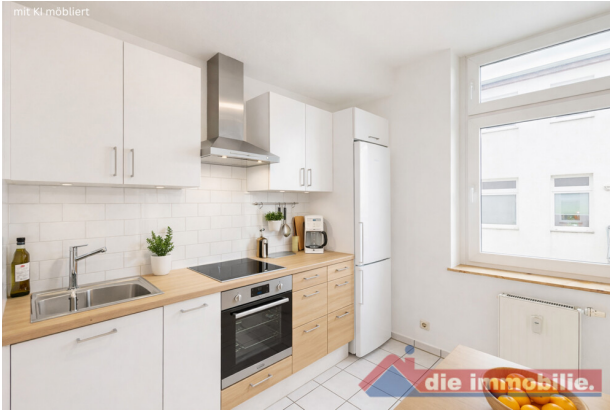
Küche mit KI möbliert