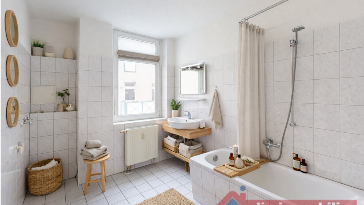
Bad mit KI möbliert