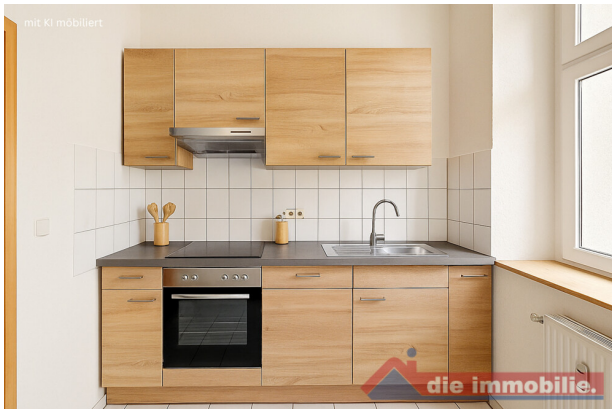
Küche_2 mit KI möbliert