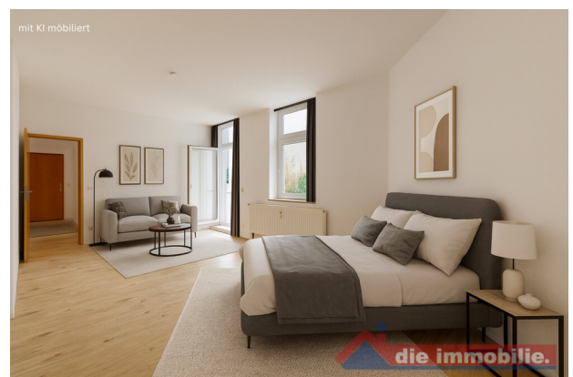
Wohn-&Schlafbereich mit KI möbliert