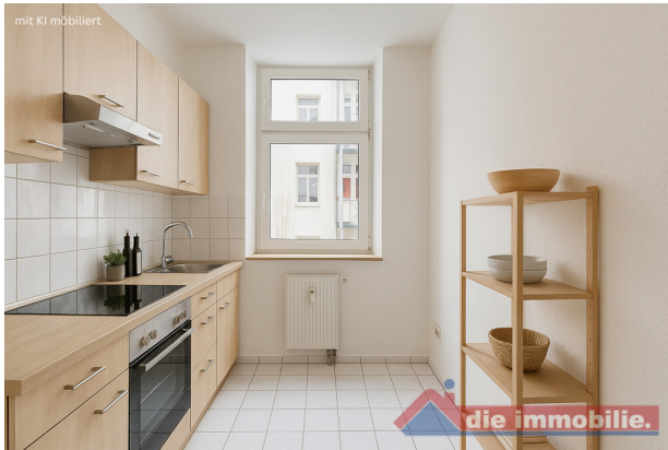
Küche mit KI möbliert