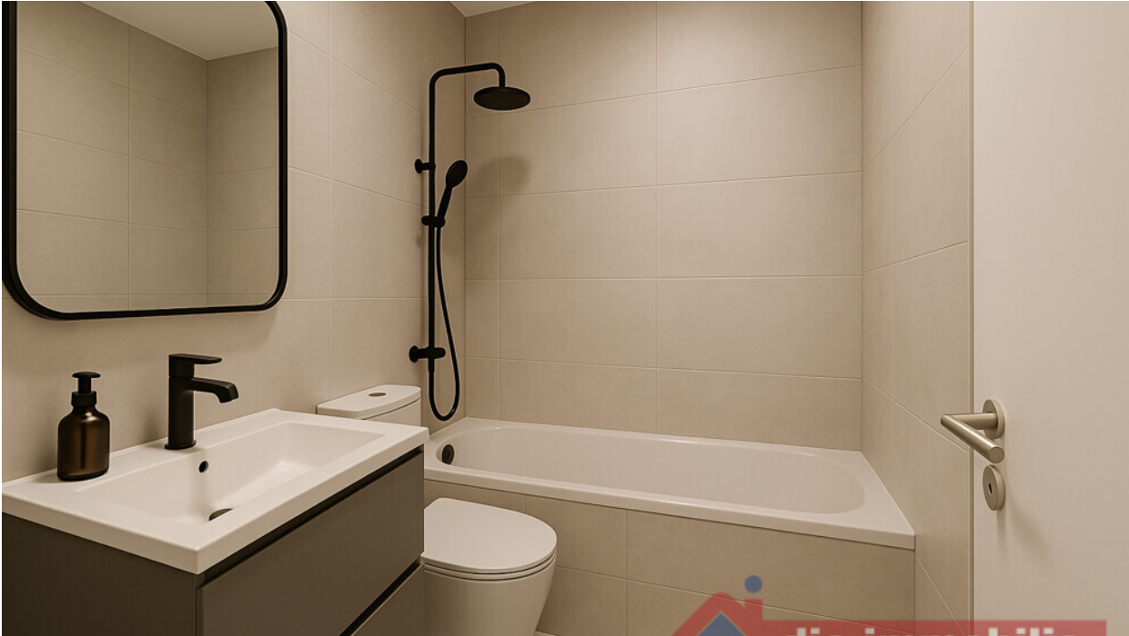
Bad mit KI möbliert