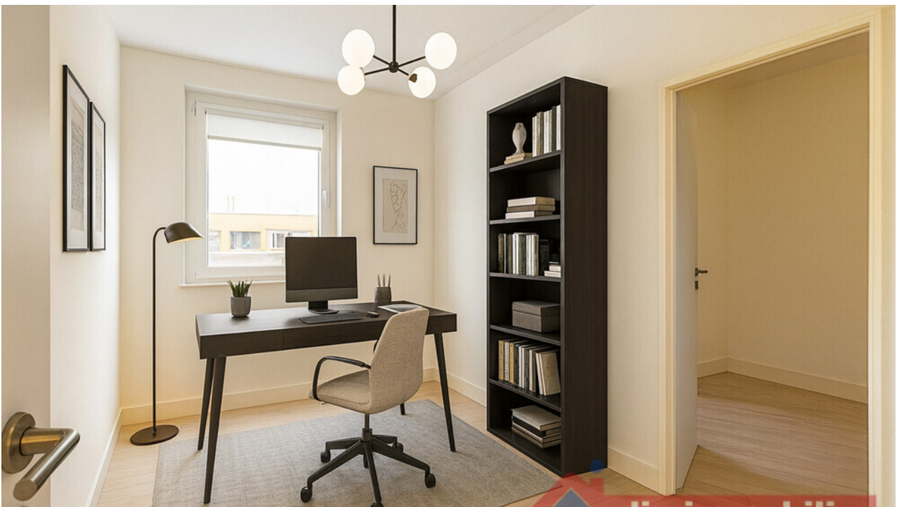
Büro mit KI möbliert