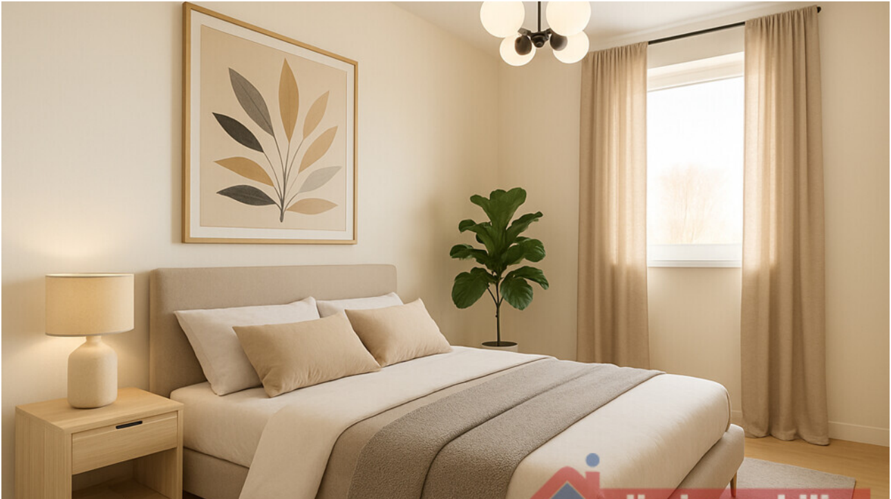
Schlafzimmer mit KI möbliert