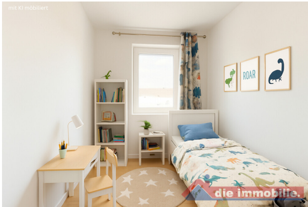
Kinderzimmer mit KI möbliert