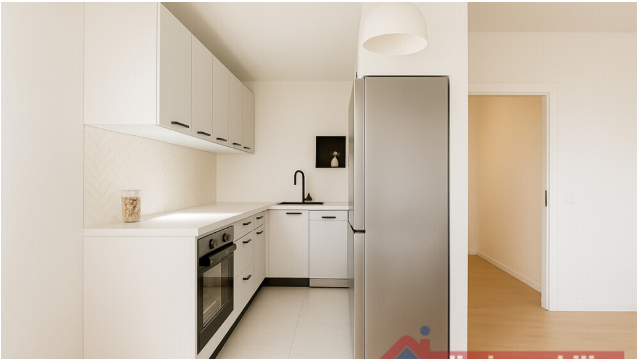
Küche mit KI möbliert