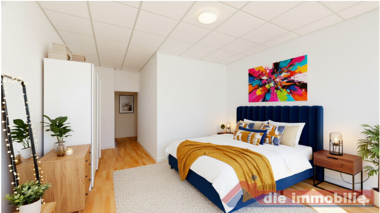
KI- möbliertes Schlafzimmer