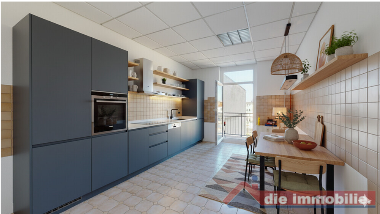
KI - möblierte Küche