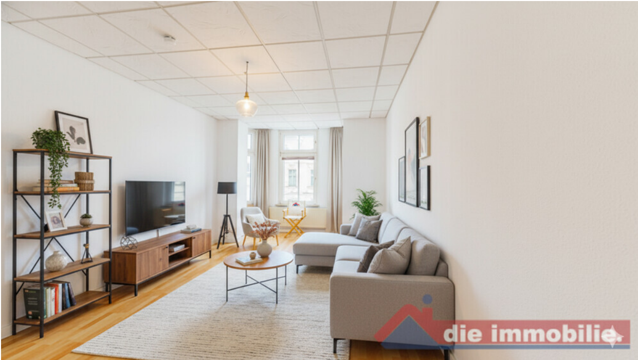
KI - möbliertes Wohnzimmer