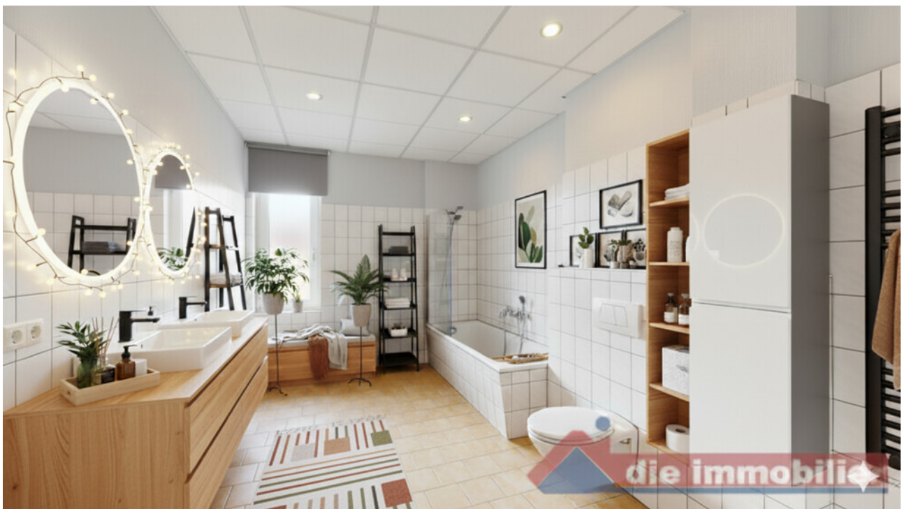
KI - möbliertes Badezimmer