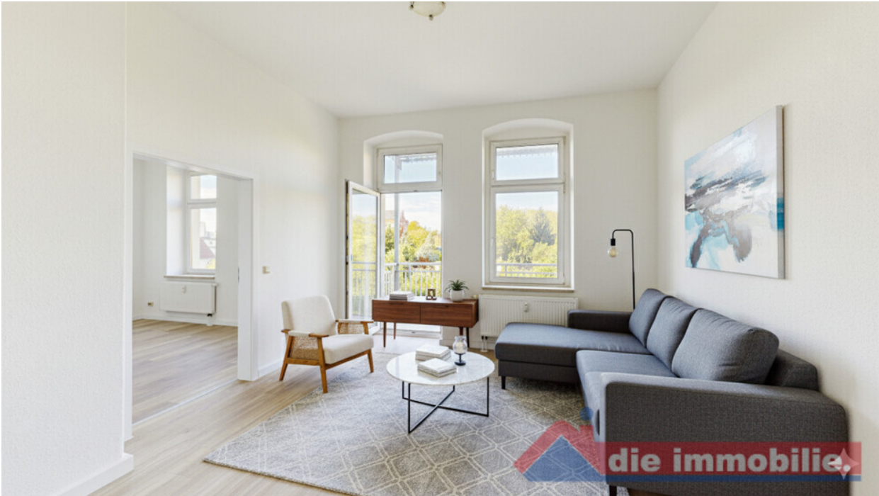
KI - möbliertes Wohnzimmer_WE 6