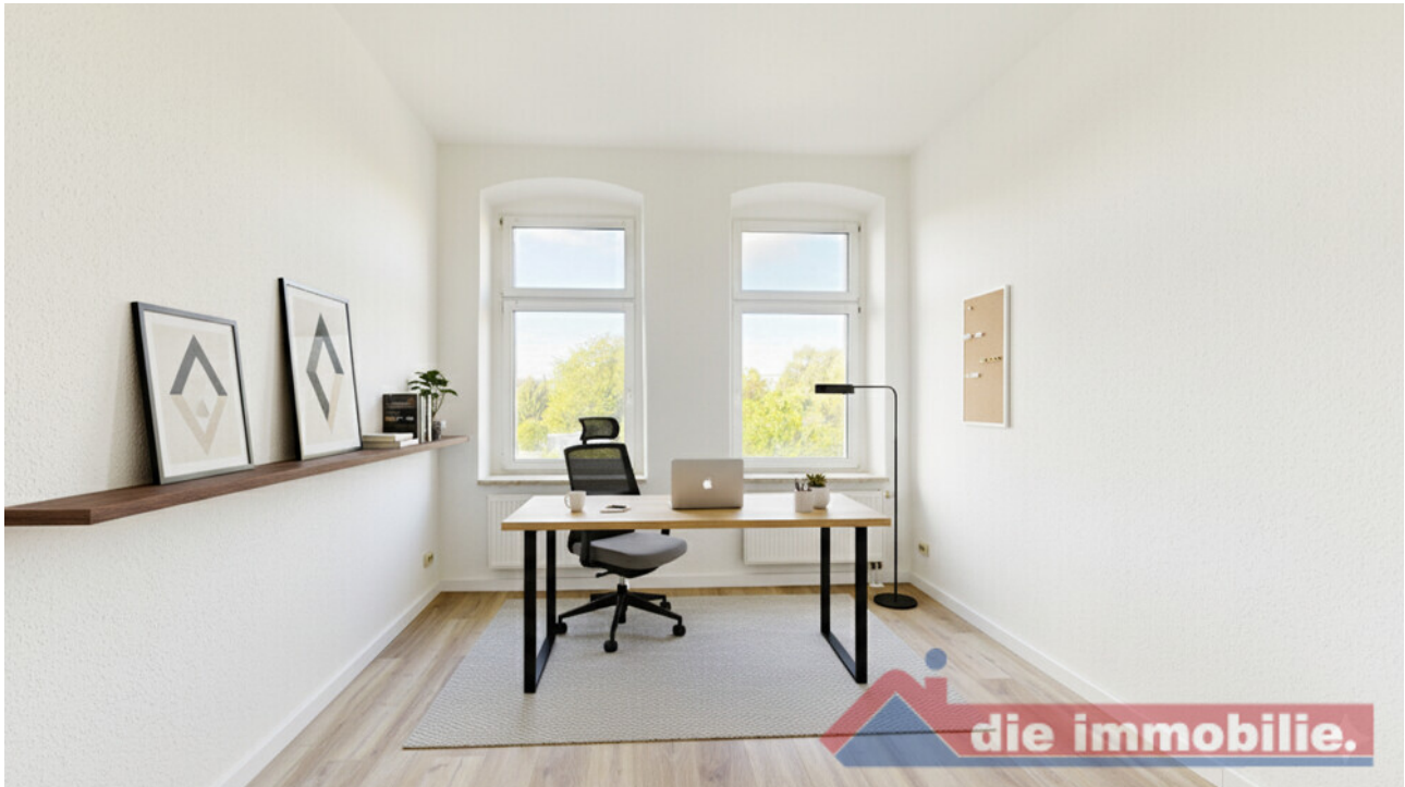
KI - möbliertes Arbeitszimmer_WE 6