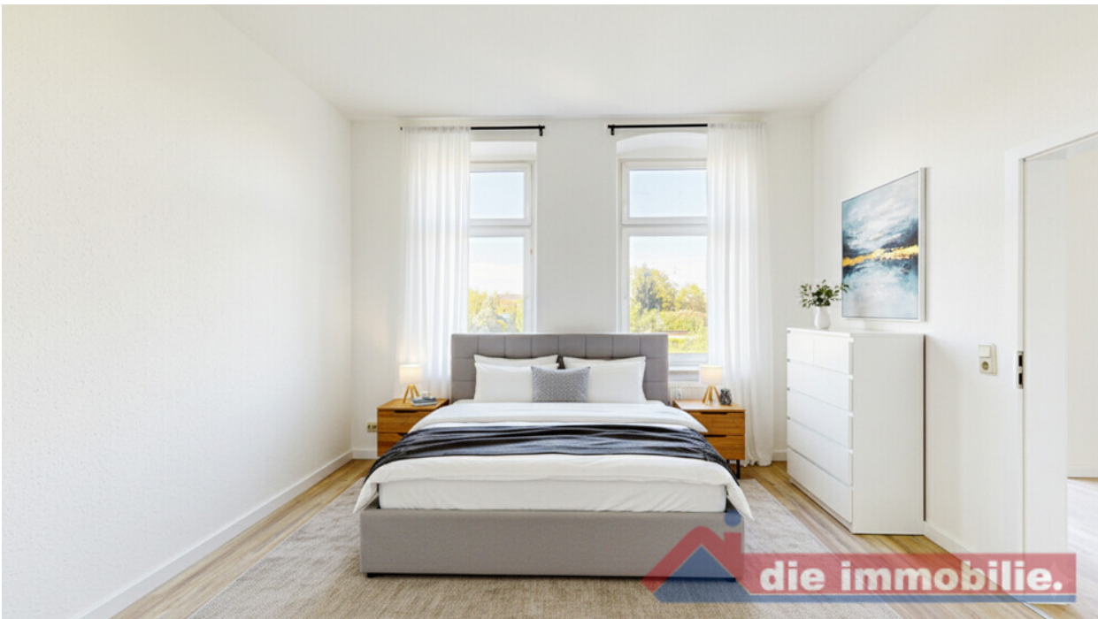
KI - möbliertes Schlafzimmer_WE 6