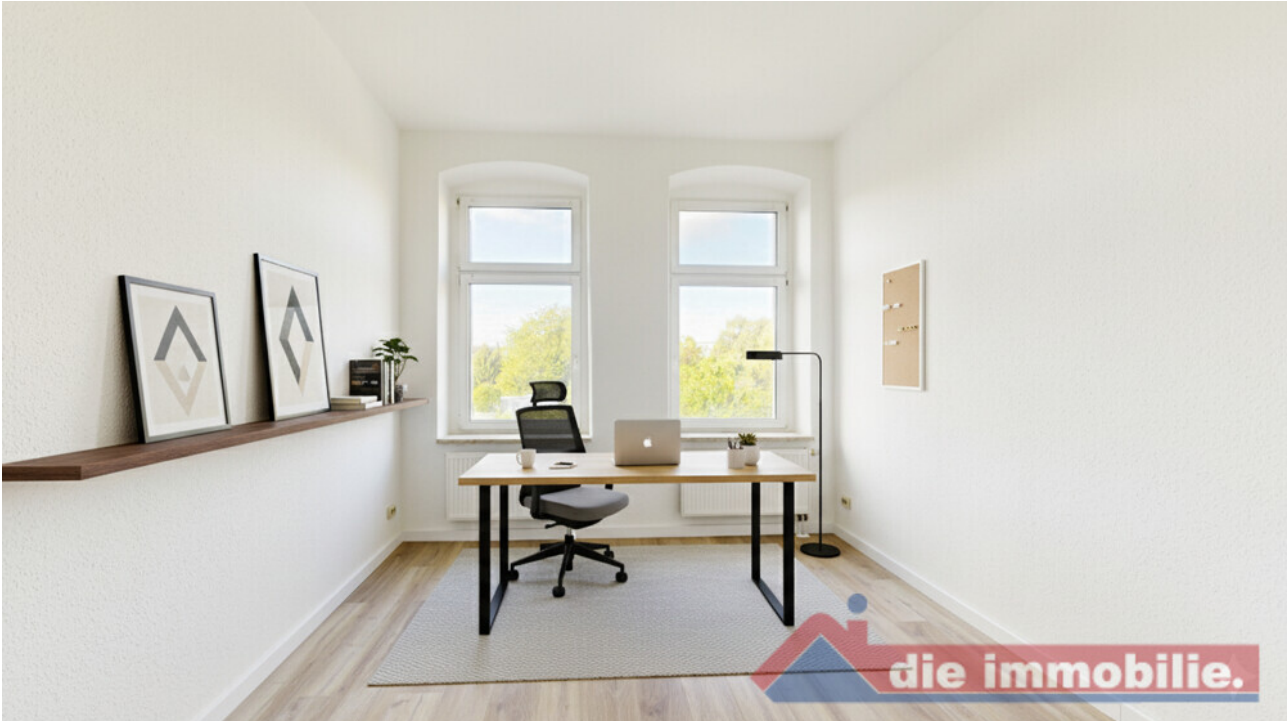
KI - möbliertes Arbeitszimmer_WE 6