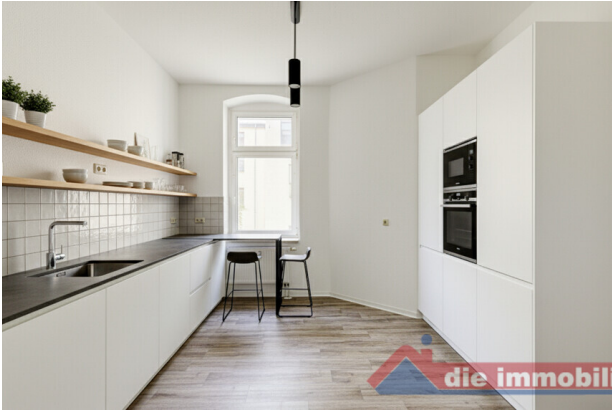
KI - möblierte Küche_WE 6