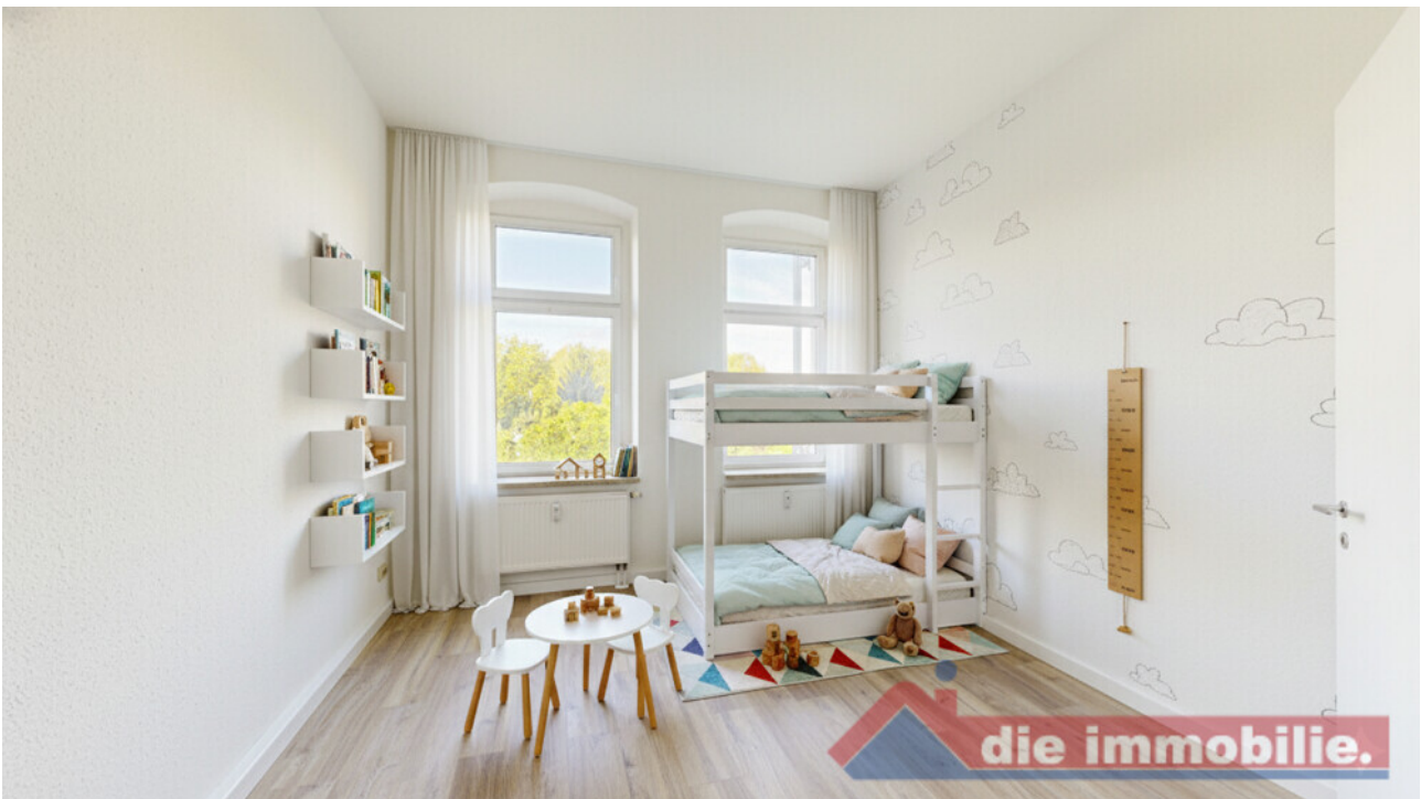
KI - möbliertes Kinderzimmer_WE 6