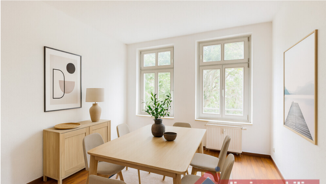
Esszimmer - mit KI möbliert