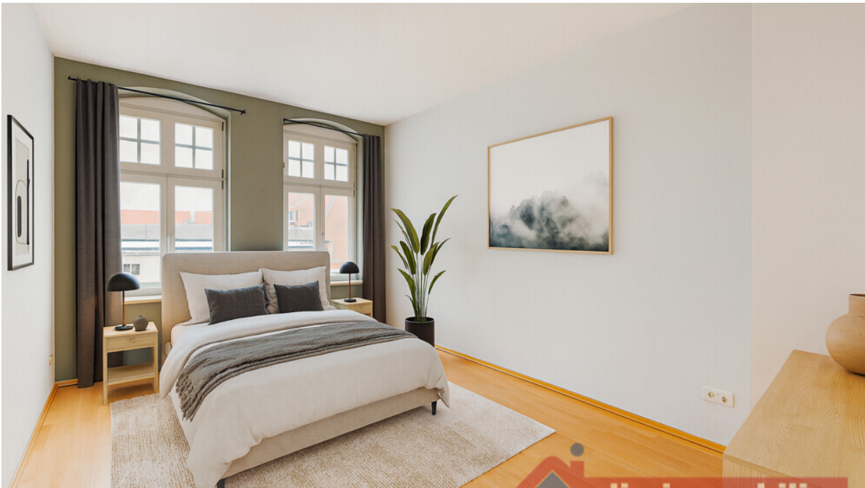
Schlafzimmer - mit KI möbliert