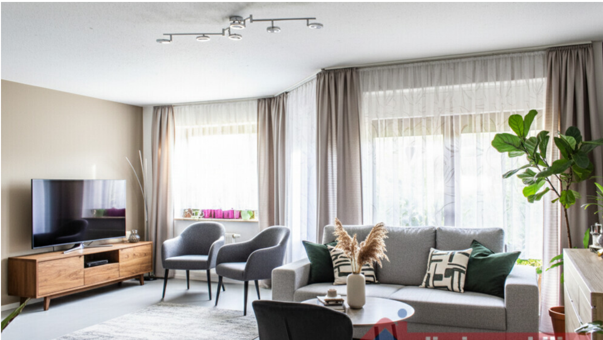
Wohnzimmer - mit KI möbliert