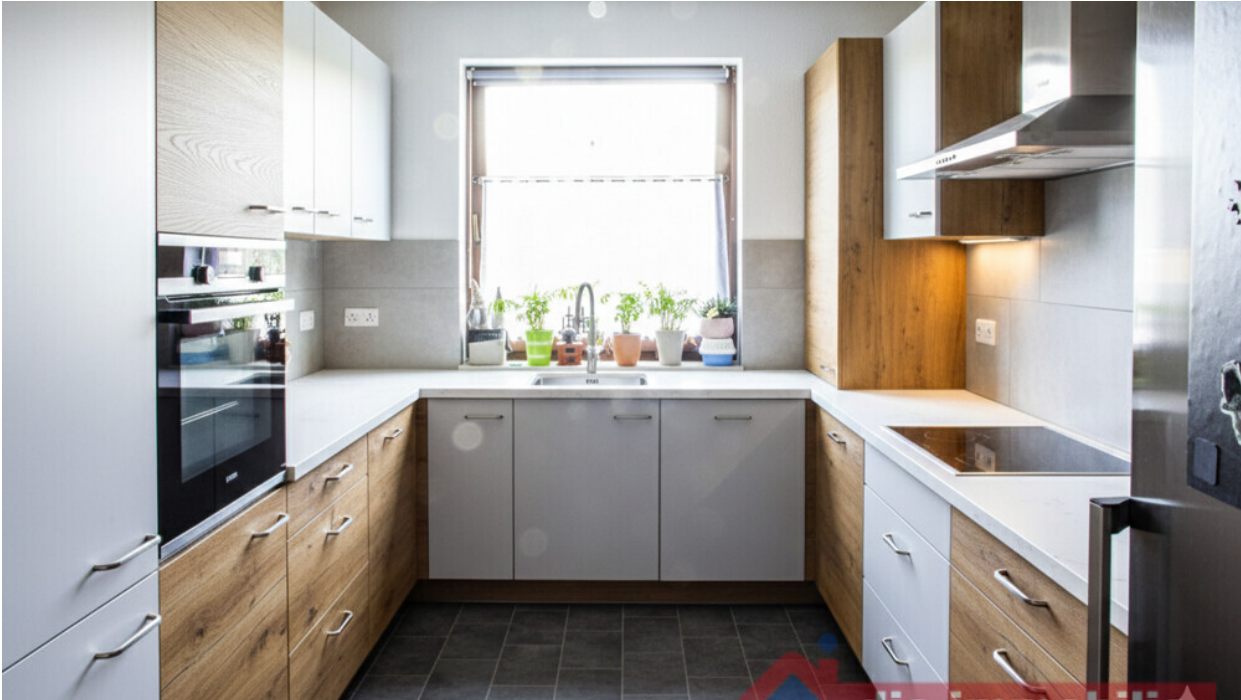
Küche - mit KI möbliert