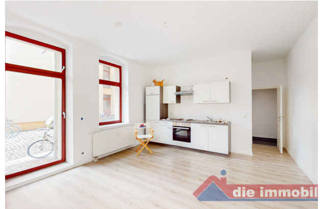
Wohn- & Essbereich_1