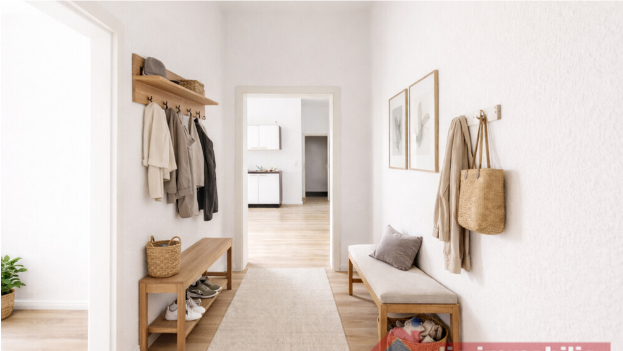
Flur mit KI möbliert