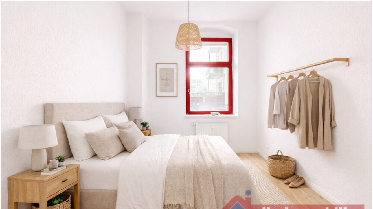
Schlafzimmer mit KI möbliert