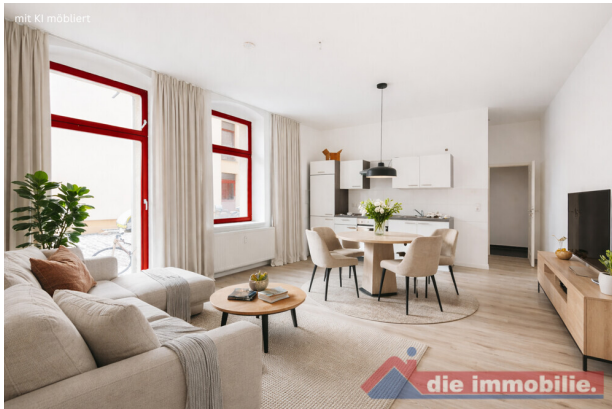
Wohnzimmer mit KI möbliert