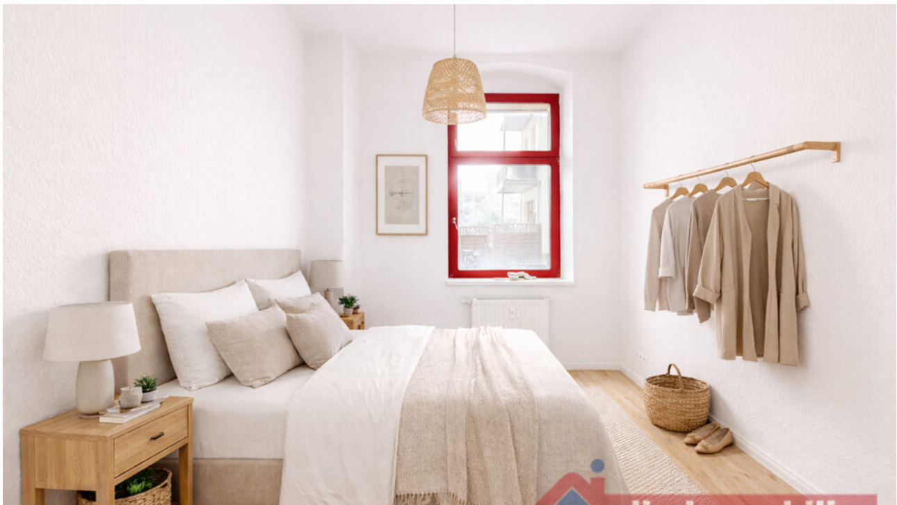
Schlafzimmer mit KI möbliert