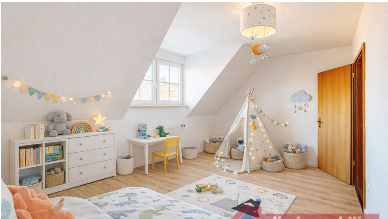
Kinderzimmer_2 mit KI möbliert