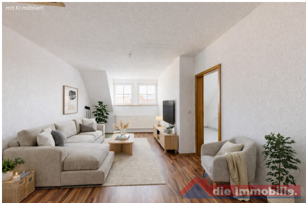
Wohnzimmer mit KI möbliert