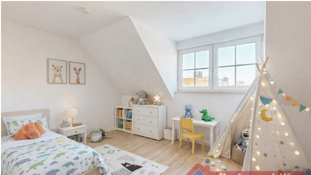
Kinderzimmer_1 mit KI möbliert