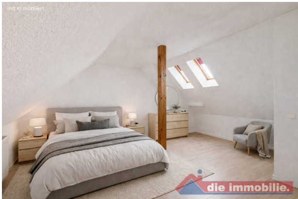
Schlafzimmer mit KI möbliert