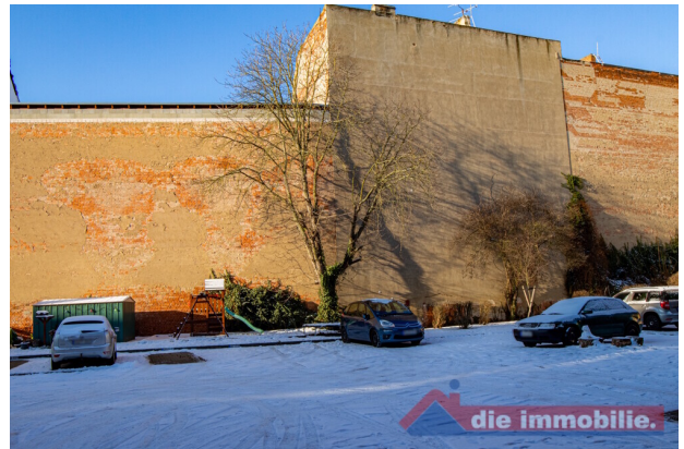
Innenhof mit Parkplatz