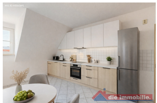
Küche mit KI möbliert