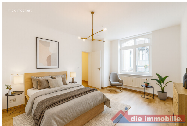
Schlafzimmer mit KI möbliert