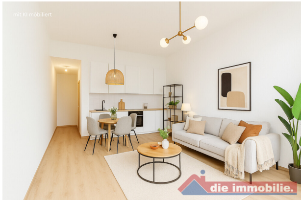
Wohnzimmer mit KI möbliert