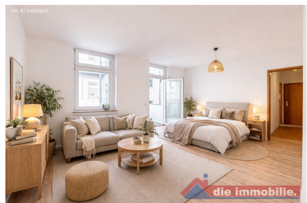
Schlaf-&Wohnzimmer mit KI möbliert