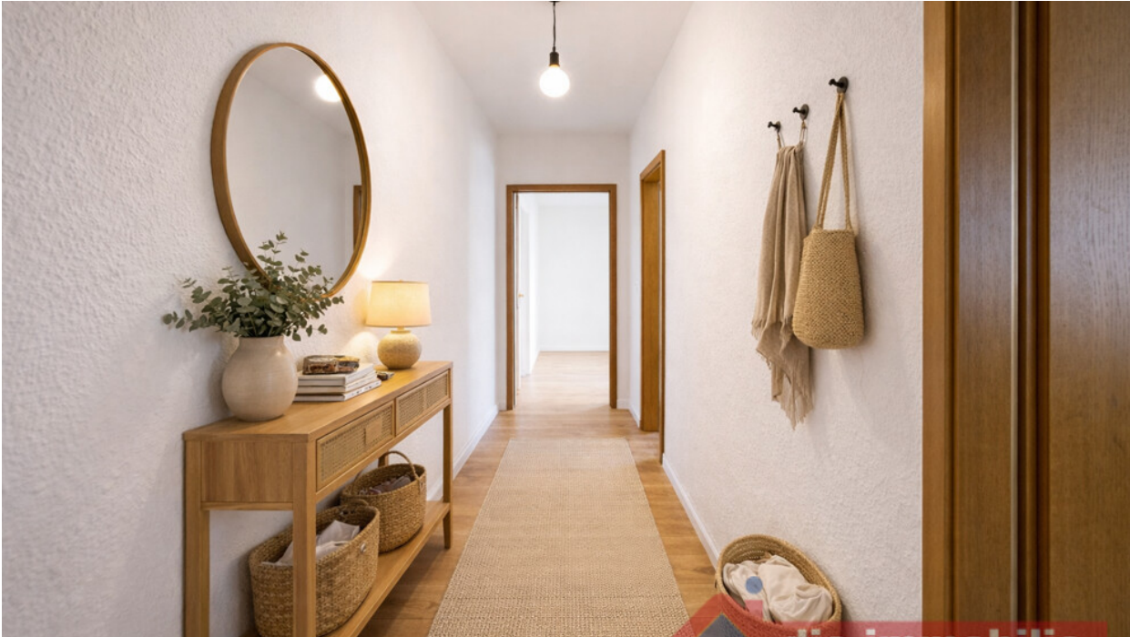
Flur mit KI möbliert