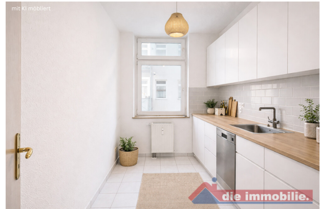
Küche mit KI möbliert