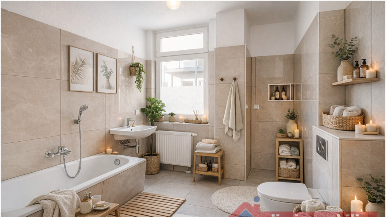
Bad mit KI möbliert