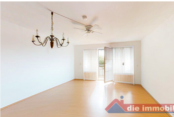
Viel Platz für Wohnen, Essen und Entspannen