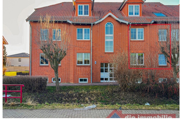
Wohnanlage mit angenehmem Umfeld und kurzen Wegen