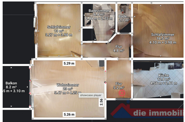
Übersichtlicher Grundriss mit praktischer Erdgeschosslösung