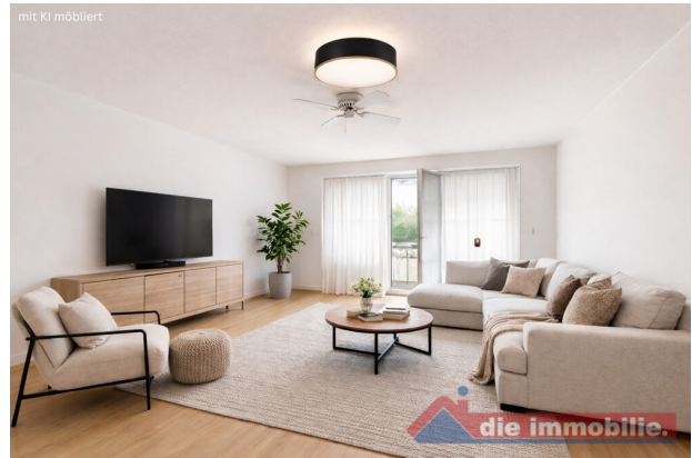
Großzügiger Wohnbereich mit wohnlicher Atmosphäre - mit KI möbliert