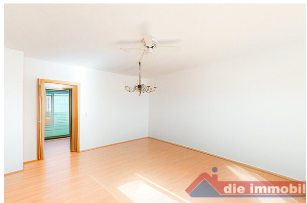
Offener Wohnraum mit direktem Zugang zum Balkon