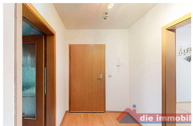
Zusätzlicher Flurbereich mit klarer Raumentrennung