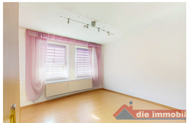
Zweites Schlafzimmer – ideal für Kind, Gast oder Büro