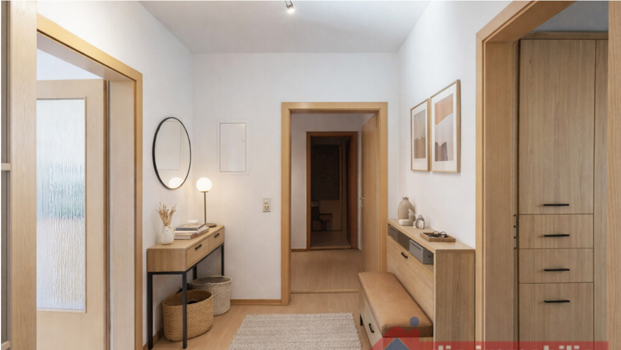
Barrierearmer Eingangsbereich mit angenehmer Breite und klarer Wegeführung - mit KI möbliert