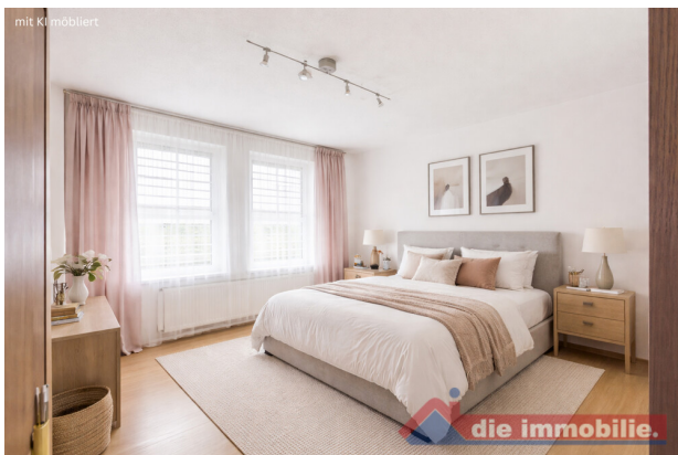
Angenehmer Rückzugsort mit wohnlicher Raumwirkung - Schlafzimmer mit KI möbliert