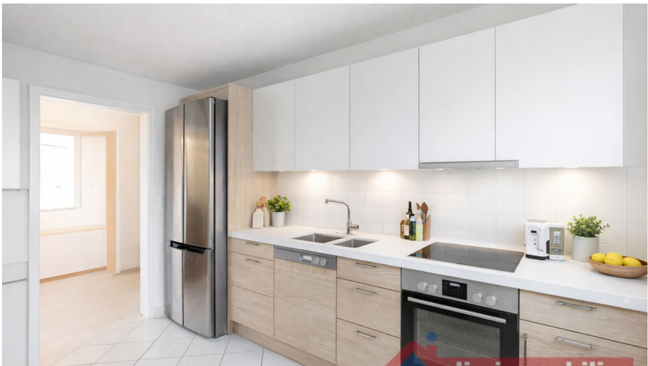
Alltagstaugliche Küche mit Platz für Kochen und kleine Esslösung - mit KI möbliert