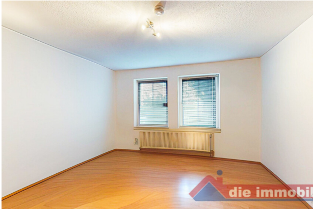
Ruhig gelegenes Schlafzimmer mit guter Stellfläche