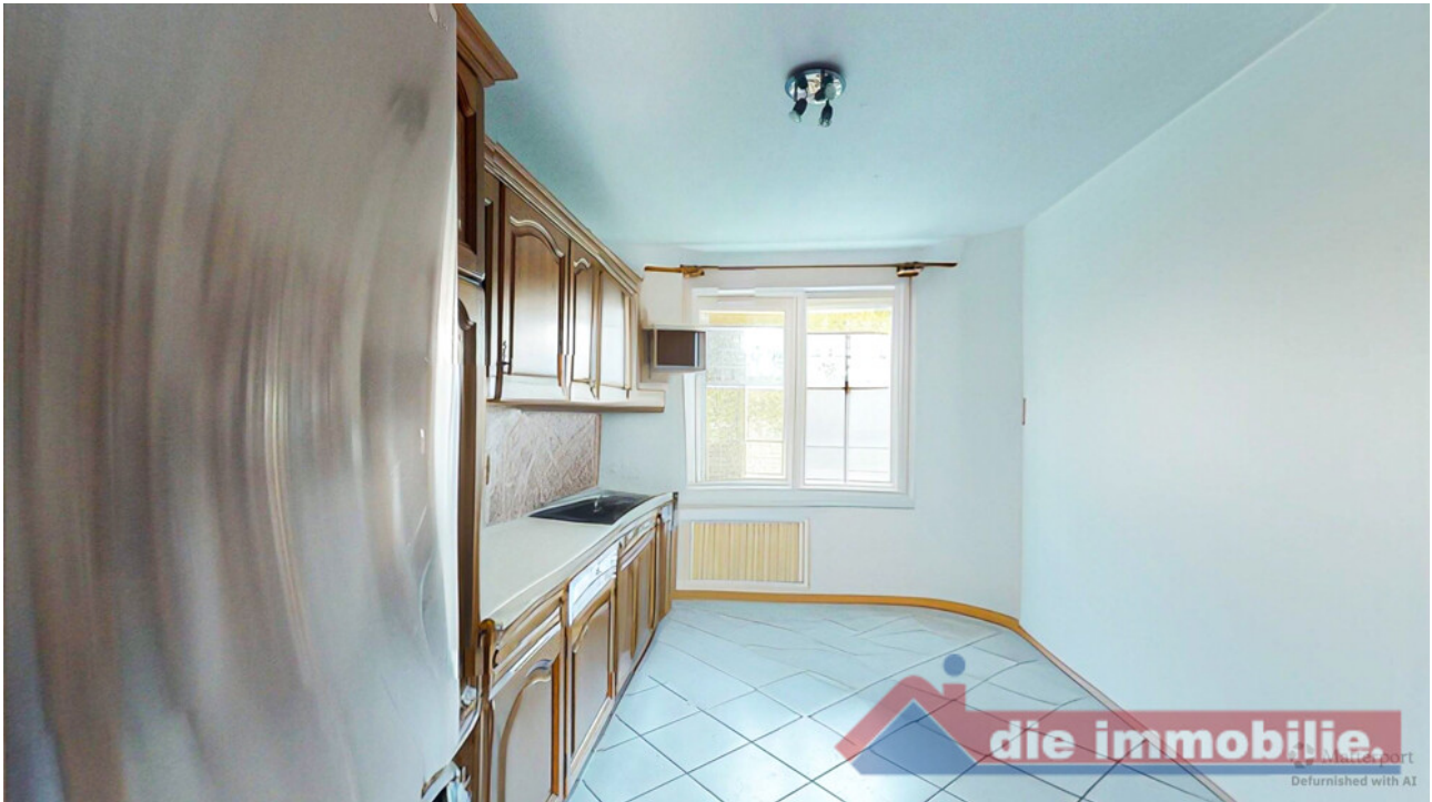
Helle Küche mit funktionalem Zuschnitt und guter Stellfläche