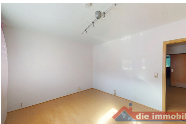
Vielseitig nutzbarer Raum mit Tageslicht