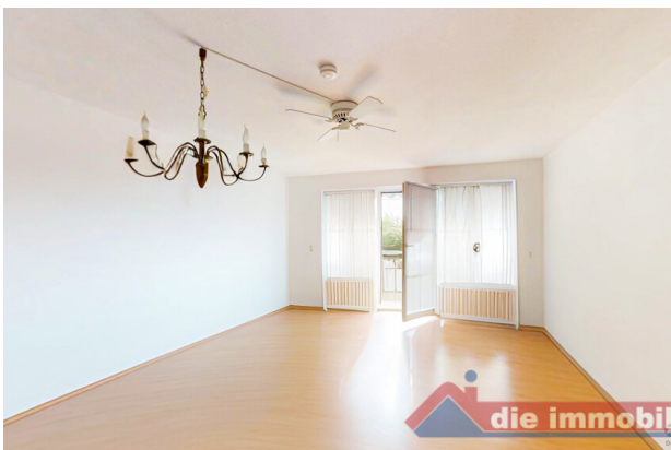
Viel Platz für Wohnen, Essen und Entspannen