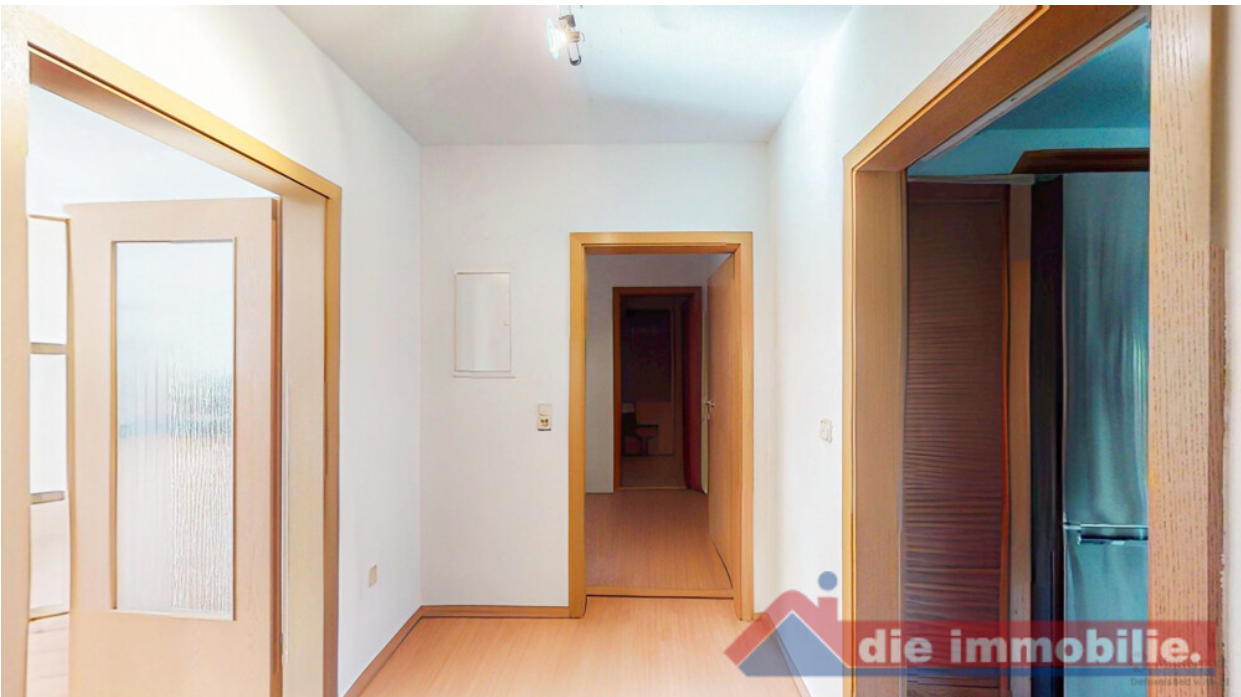
Zentraler Flur mit direkter Anbindung aller Wohnräume – praktisch im Alltag