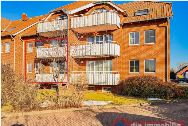
Gepflegtes Mehrfamilienhaus in ruhiger Wohnlage