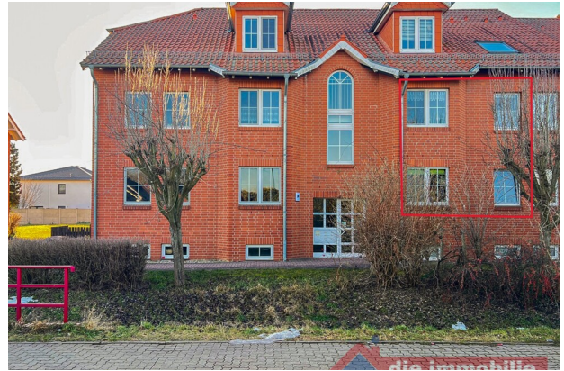
Wohnanlage mit angenehmem Umfeld und kurzen Wegen