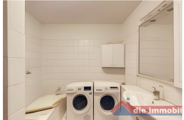
Badezimmer mit Wanne und Dusche – funktional und gepflegt