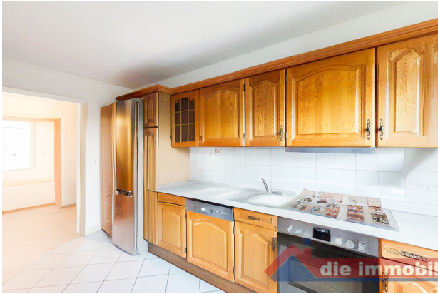
Zweiter Blick auf die Küche – übersichtlich, hell und gut nutzbar