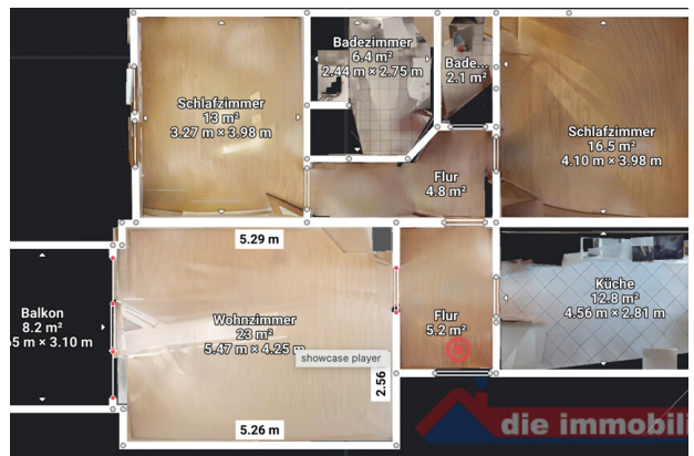
Übersichtlicher Grundriss mit praktischer Erdgeschosslösung