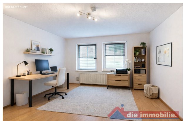
Flexibel nutzbares Zimmer – ideal als Homeoffice oder Kinderzimmer - mit KI möbliert