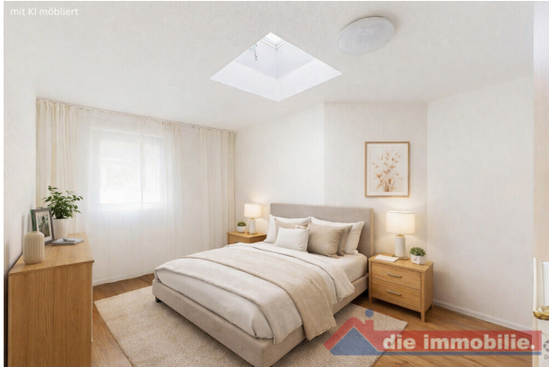
Schlafzimmer mit KI möbliert