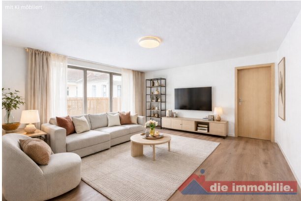
Wohnzimmer mit KI möbliert