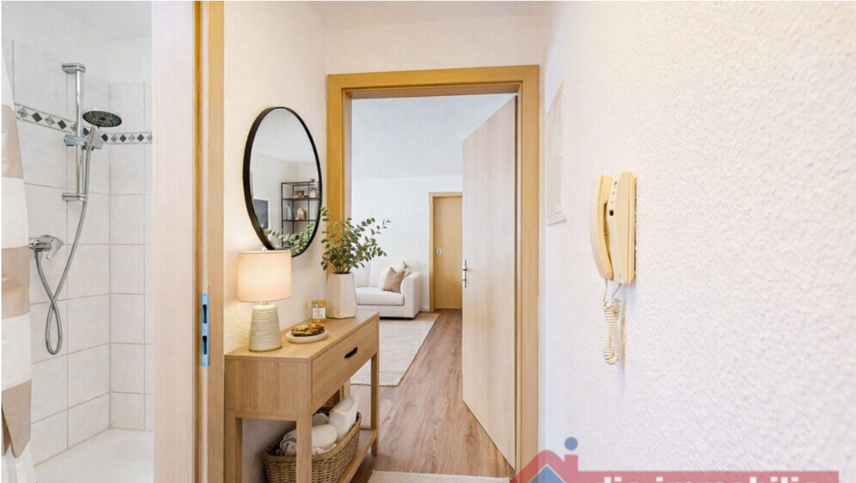
Flur mit KI möbliert