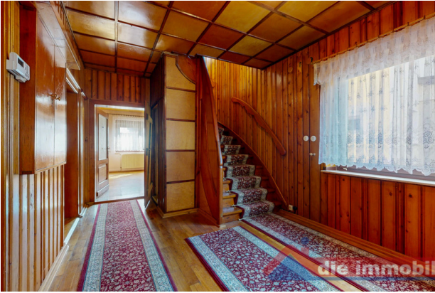
Geräumige Diele im Eingangsbereich