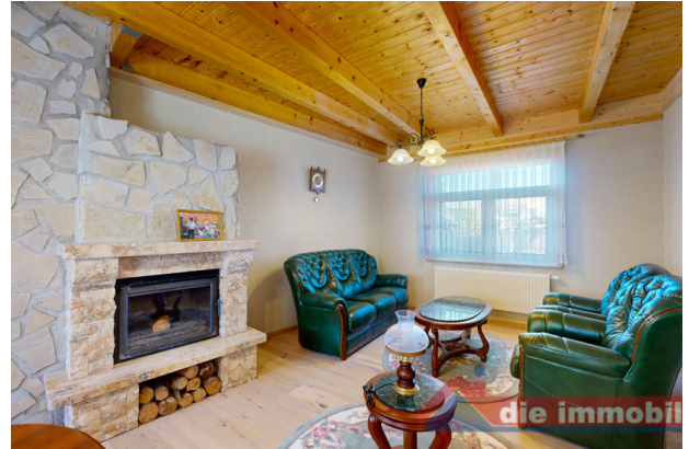
Kaminzimmer im Nebengebäude