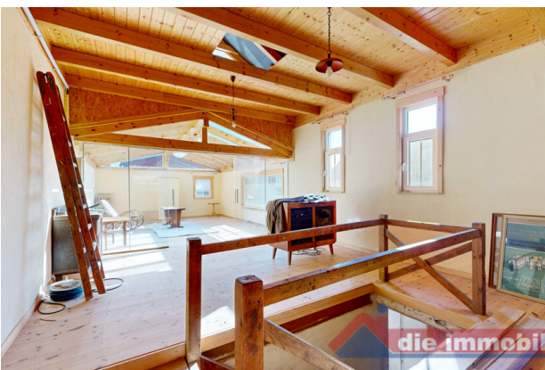
Zusätzlicher Raum im Nebengebäude