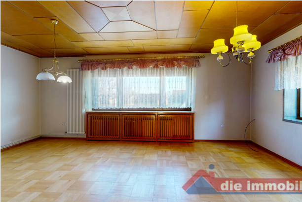
Heller Wohnraum im Obergeschoss