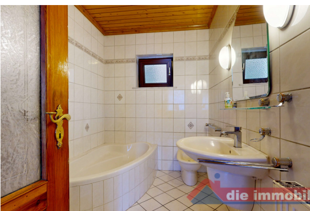
Tageslichtbad mit Wanne