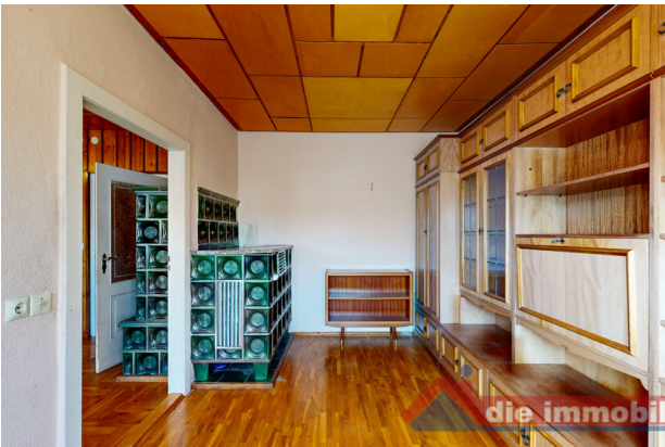
Esszimmer im Erdgeschoss