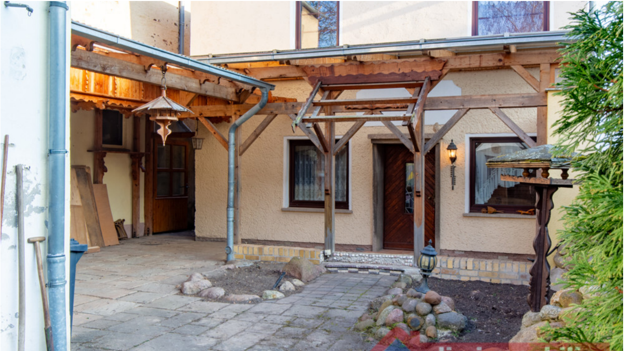
Geschützter Innenhof mit Aufenthaltsqualität