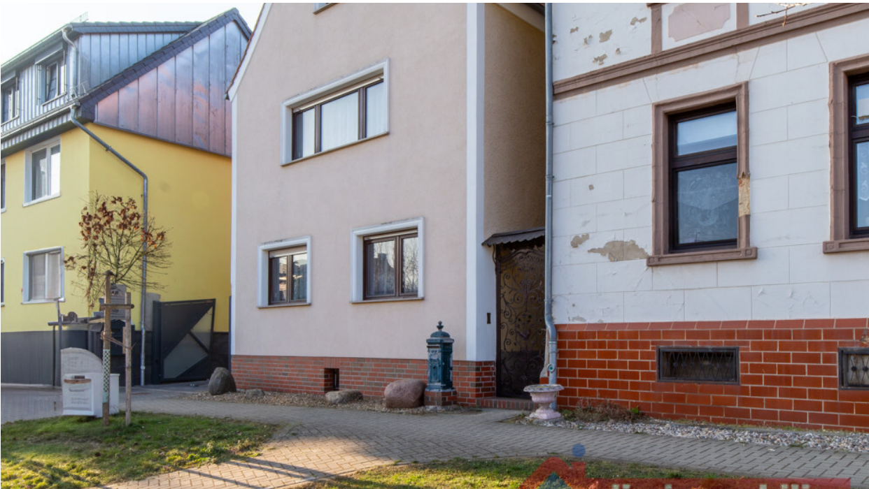
Hausansicht mit Zugang zum Grundstück