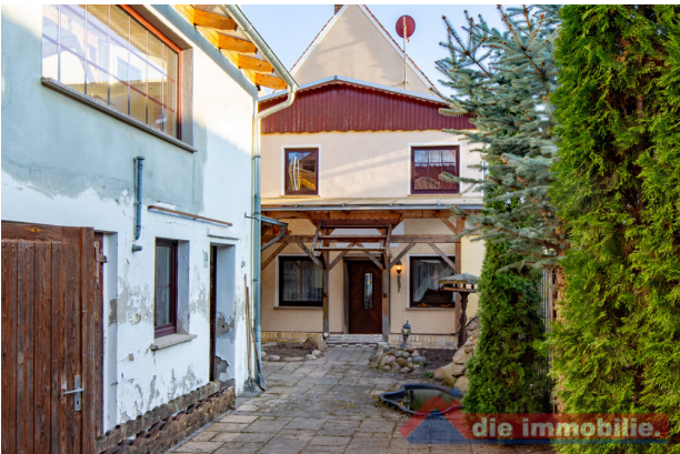
Zugang zum Nebengebäude