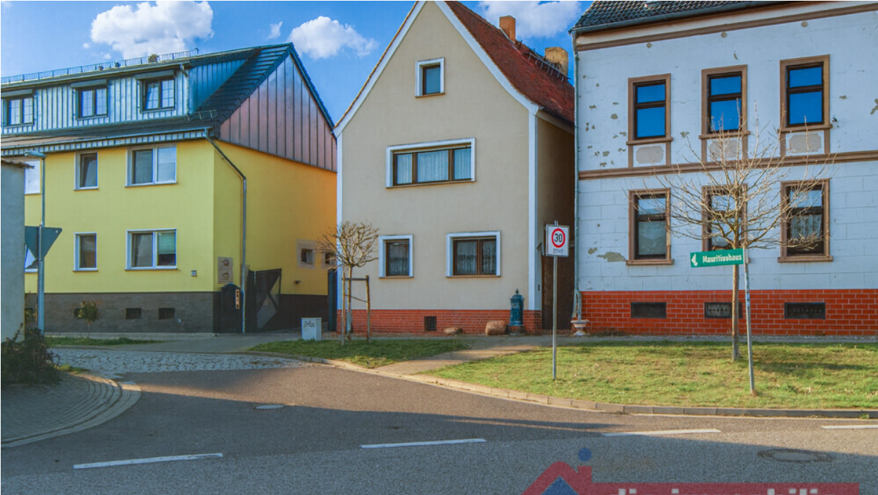
Straßenansicht des Hauses