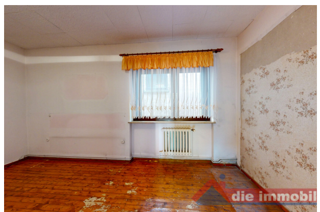
Schlafzimmer im Obergeschoss