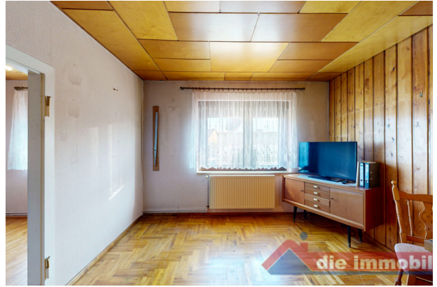
Wohnbereich mit angenehmer Raumwirkung