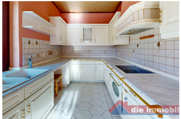
Küche mit funktionaler Aufteilung