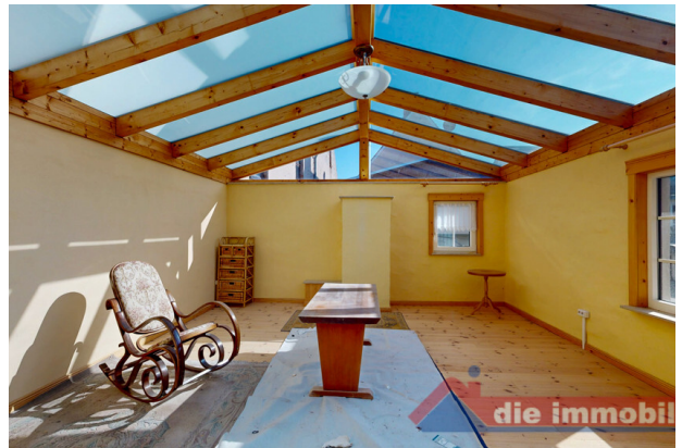
Ausgebauter Bereich im Nebengebäude