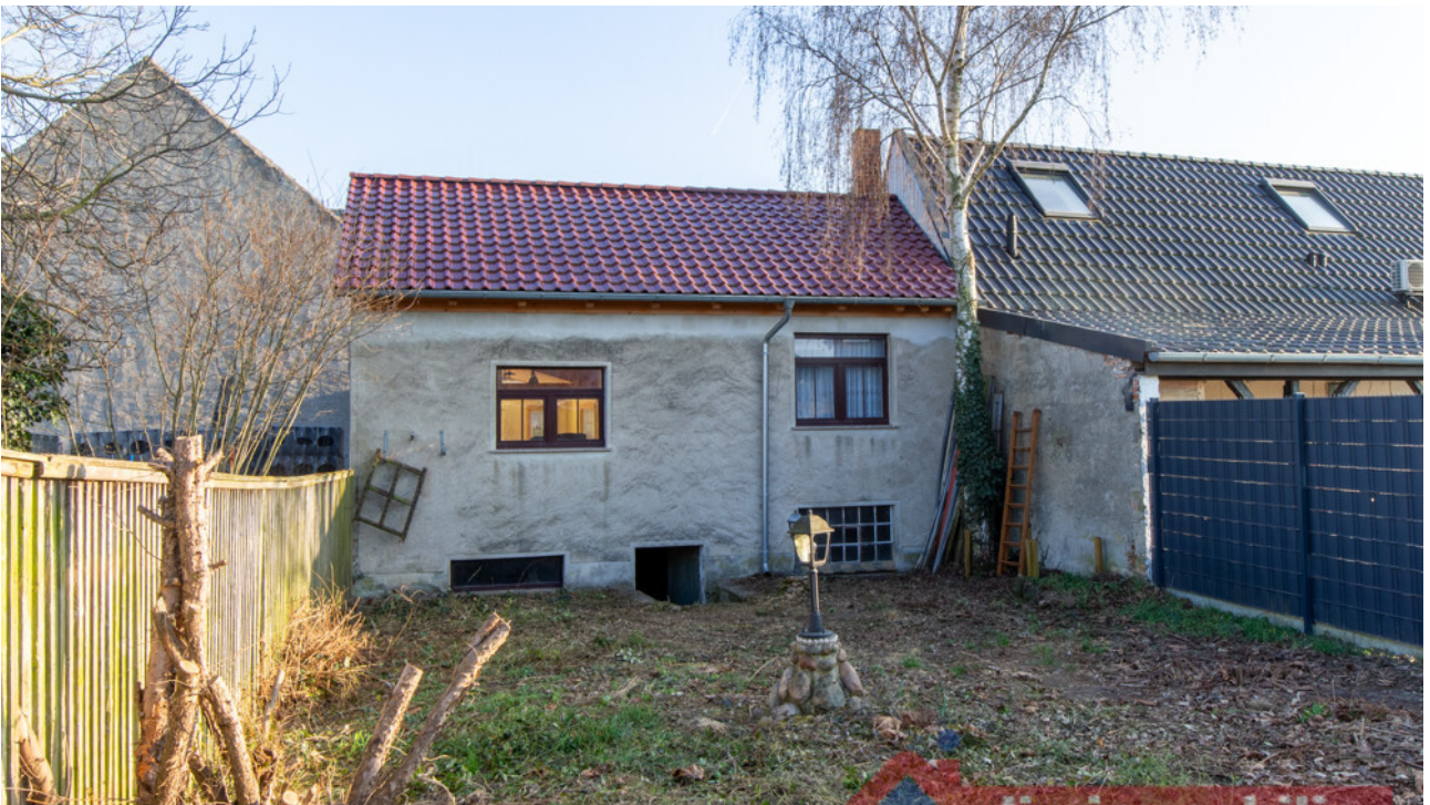
Gartenbereich mit vielseitigen Nutzungsmöglichkeiten