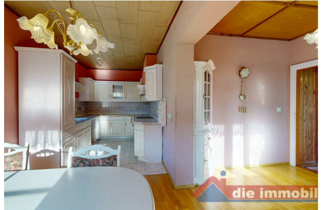
Großzügige Wohnküche im Obergeschoss