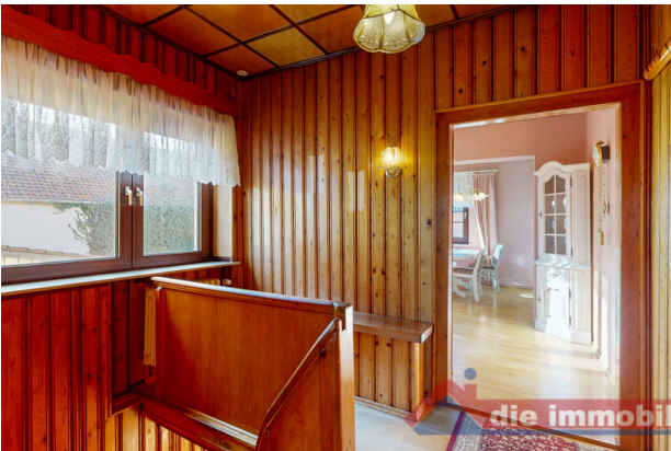
Flur im Obergeschoss