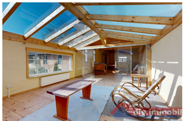
Vielseitig nutzbarer Raum im Nebengebäude