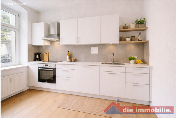
Küche mit KI möbliert