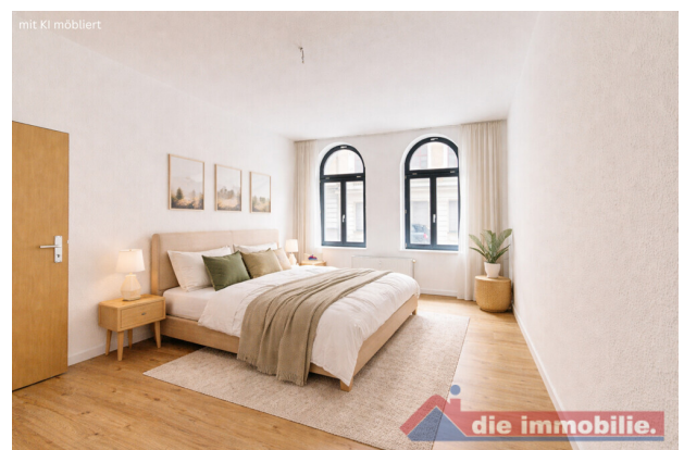
Schlafzimmer mit KI möbliert