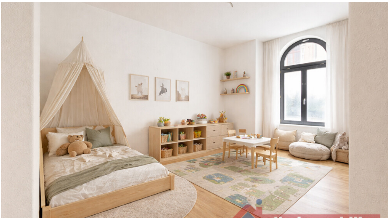
Kinderzimmer mit KI möbliert