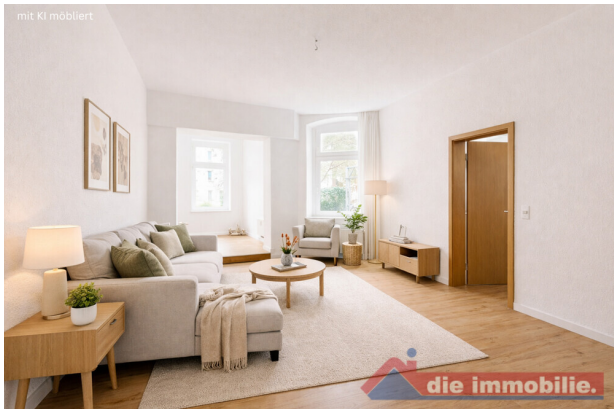
Wohnzimmer mit KI möbliert