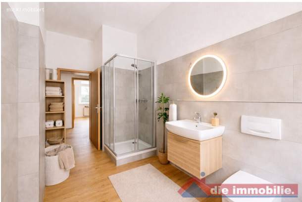
Bad mit KI möbliert