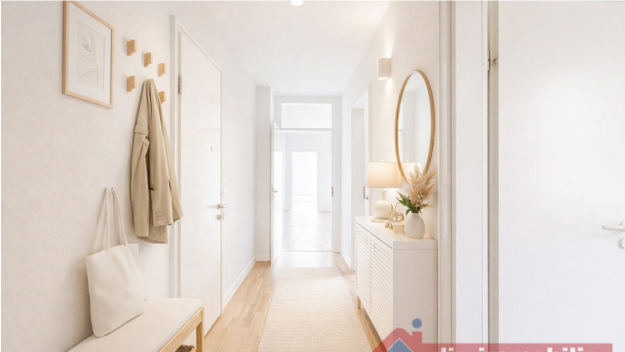
Flur mit KI möbliert