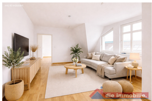
Wohnzimmer mit KI möbliert