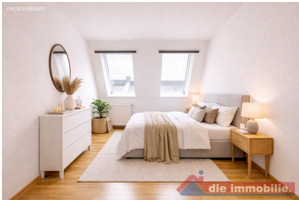
Schlafzimmer mit KI möbliert