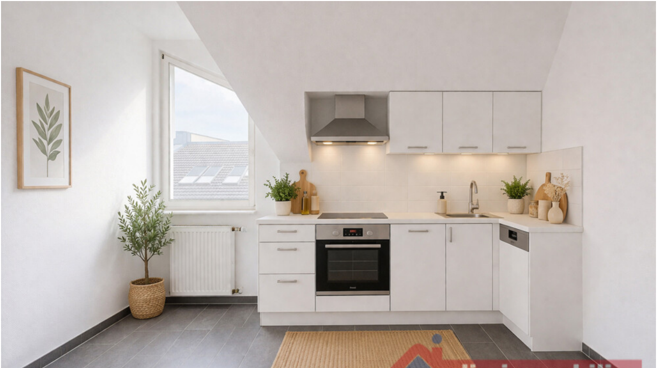
Küche mit KI möbliert