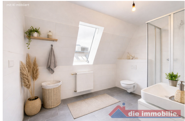
Bad mit KI möbliert