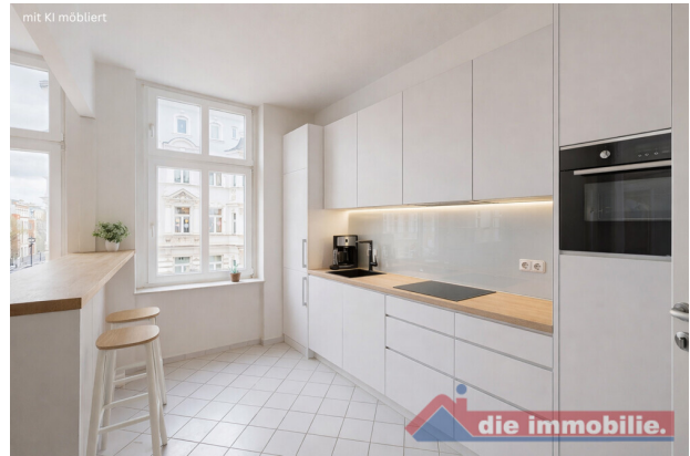
Küche mit KI möbliert