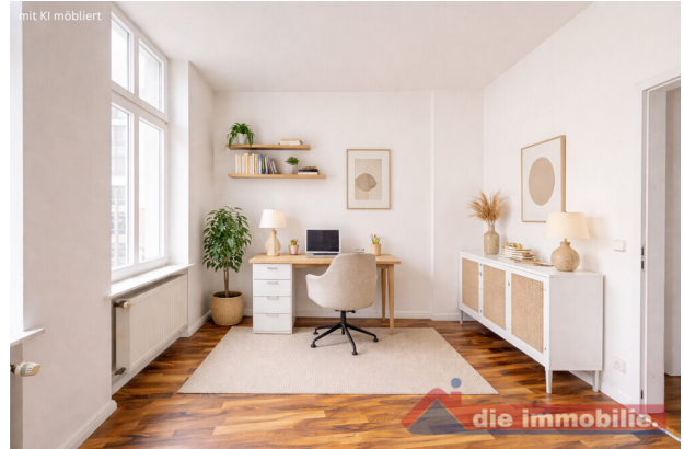
Büro mit KI möbliert