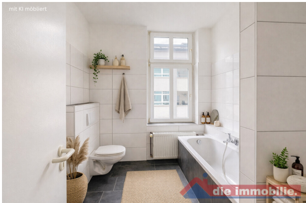
Bad mit KI möbliert