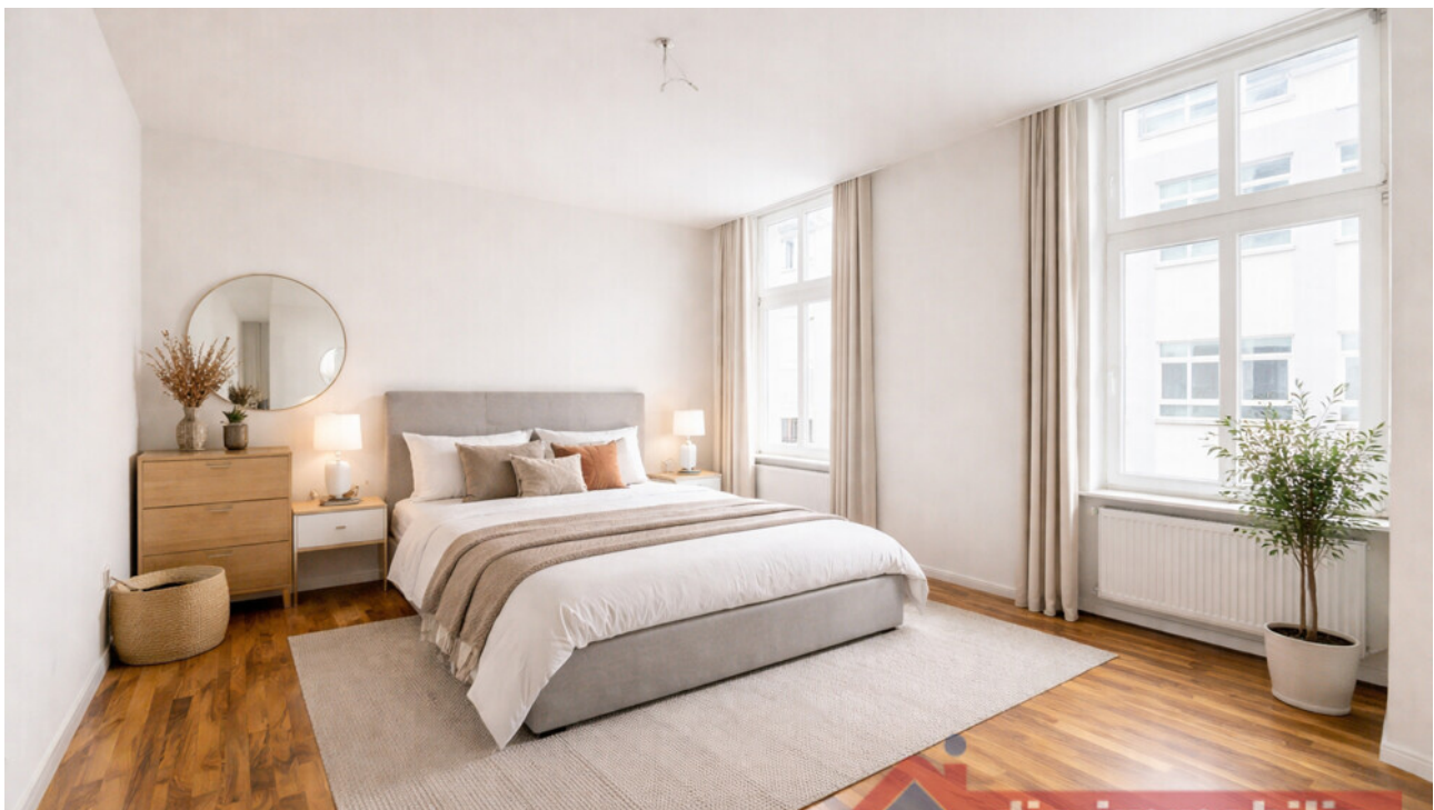
Schlafzimmer mit KI möbliert