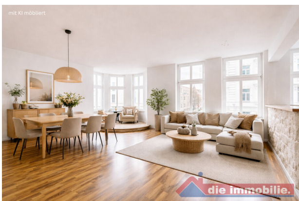
Wohnzimmer mit KI möbliert