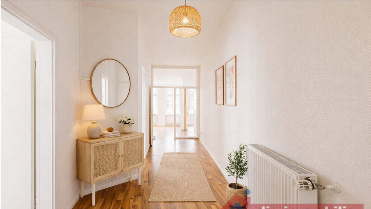
Flur mit KI möbliert