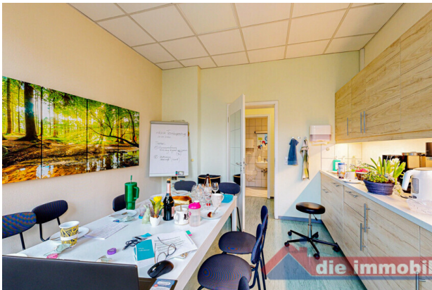
Pausenraum + Küche