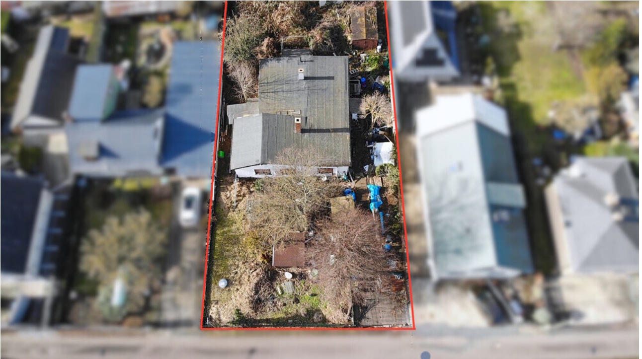
Übersicht über Grundstücksgröße und Zuschnitt