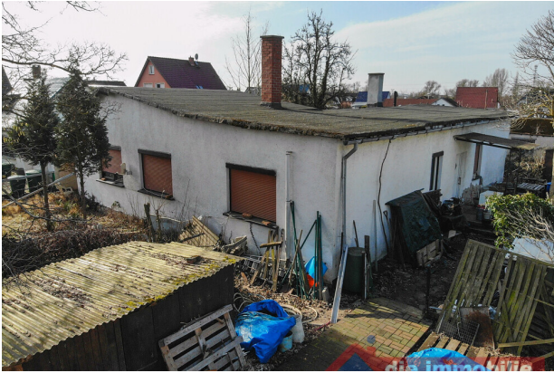
Bestandsimmobilie im aktuellen Zustand