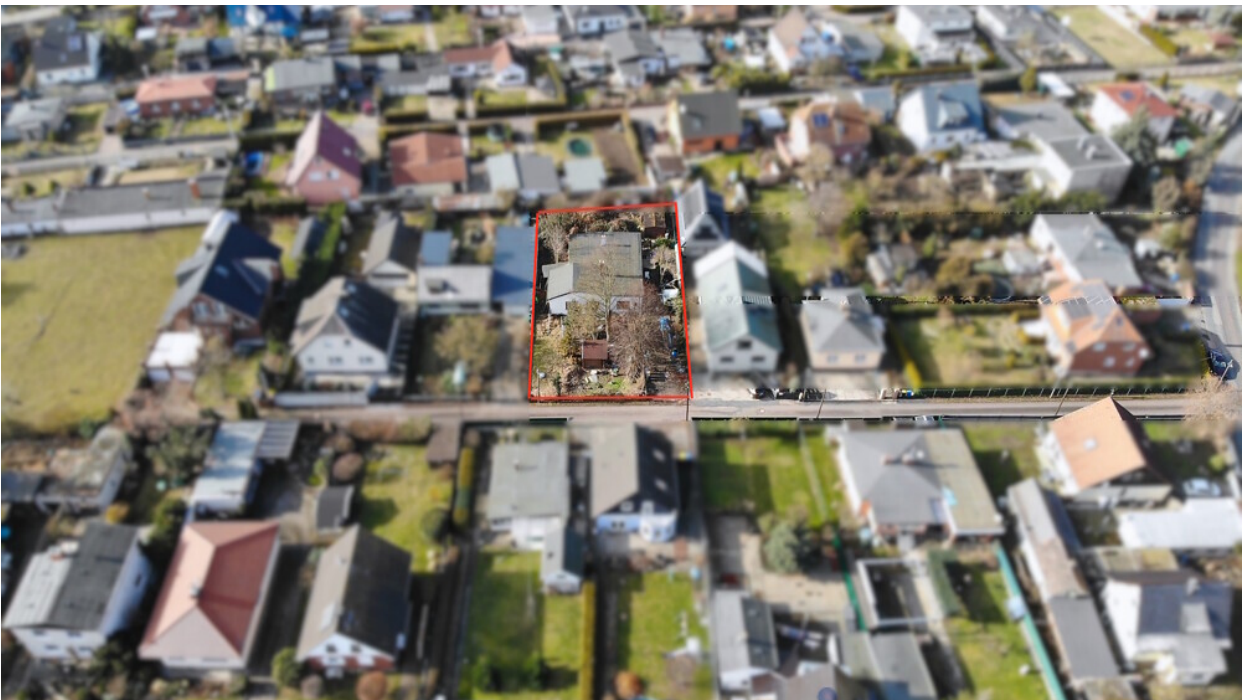
Drohnenansicht des Grundstücks im Wohnumfeld von Cracau