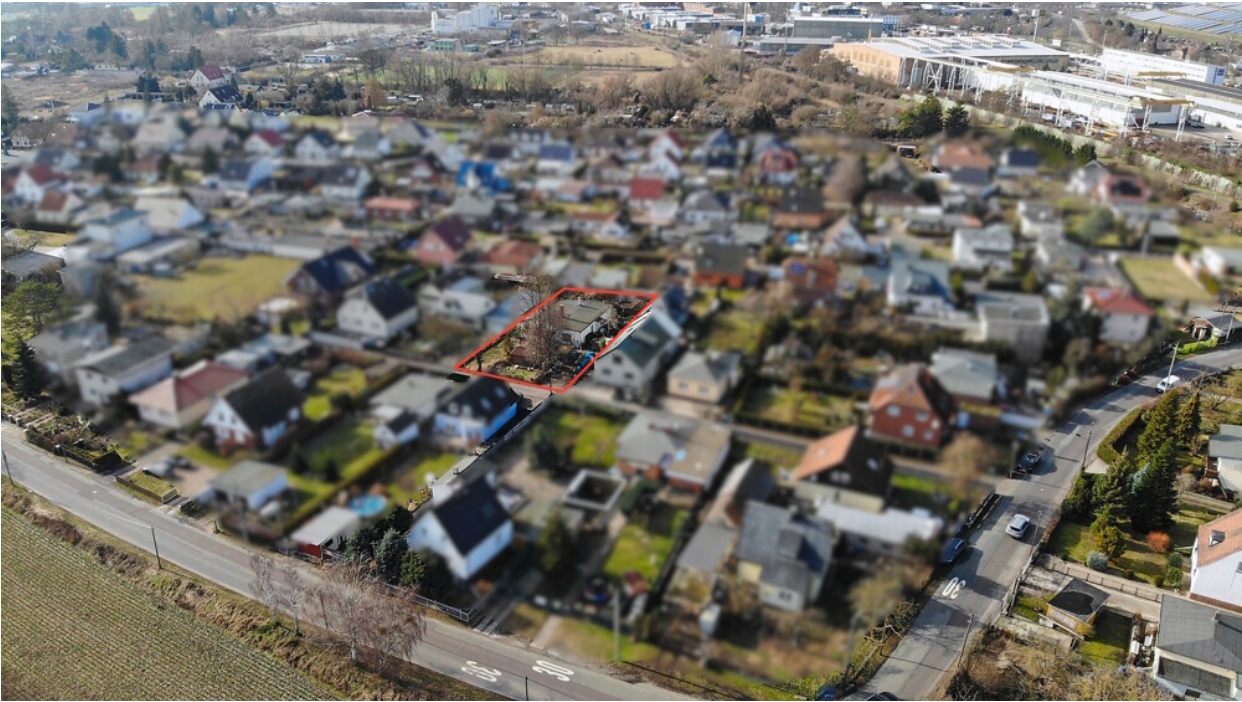
Luftaufnahme mit markiertem Grundstück im gewachsenen Wohnumfeld