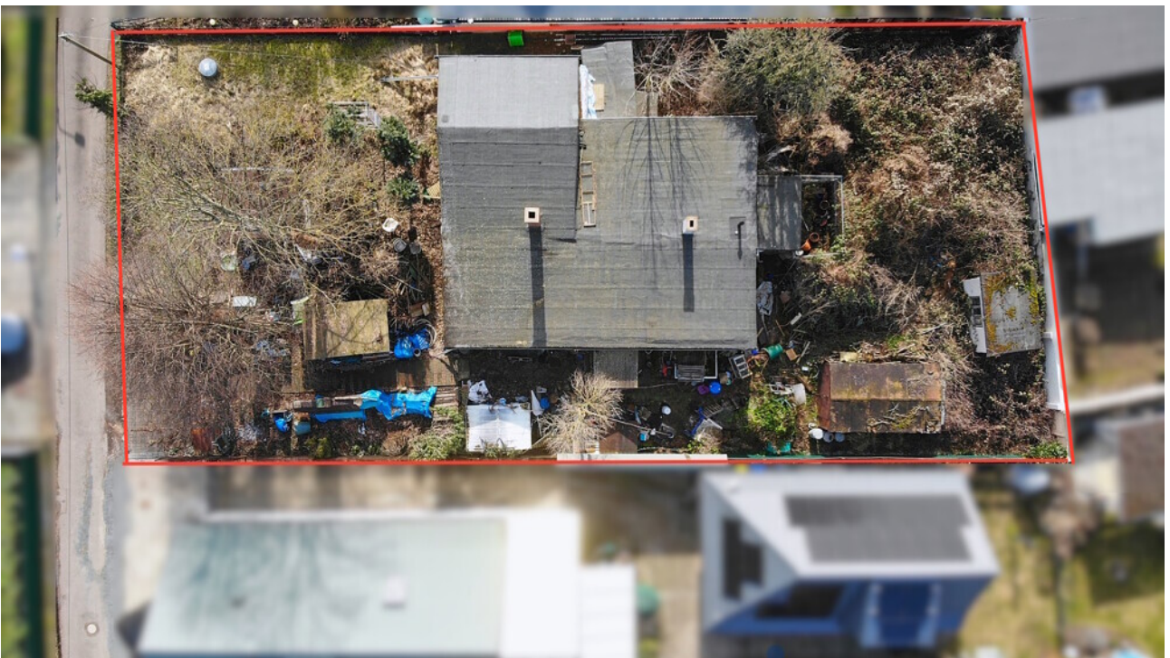
Drohnenansicht des Grundstücks mit Blick auf Lage und Zuschnitt