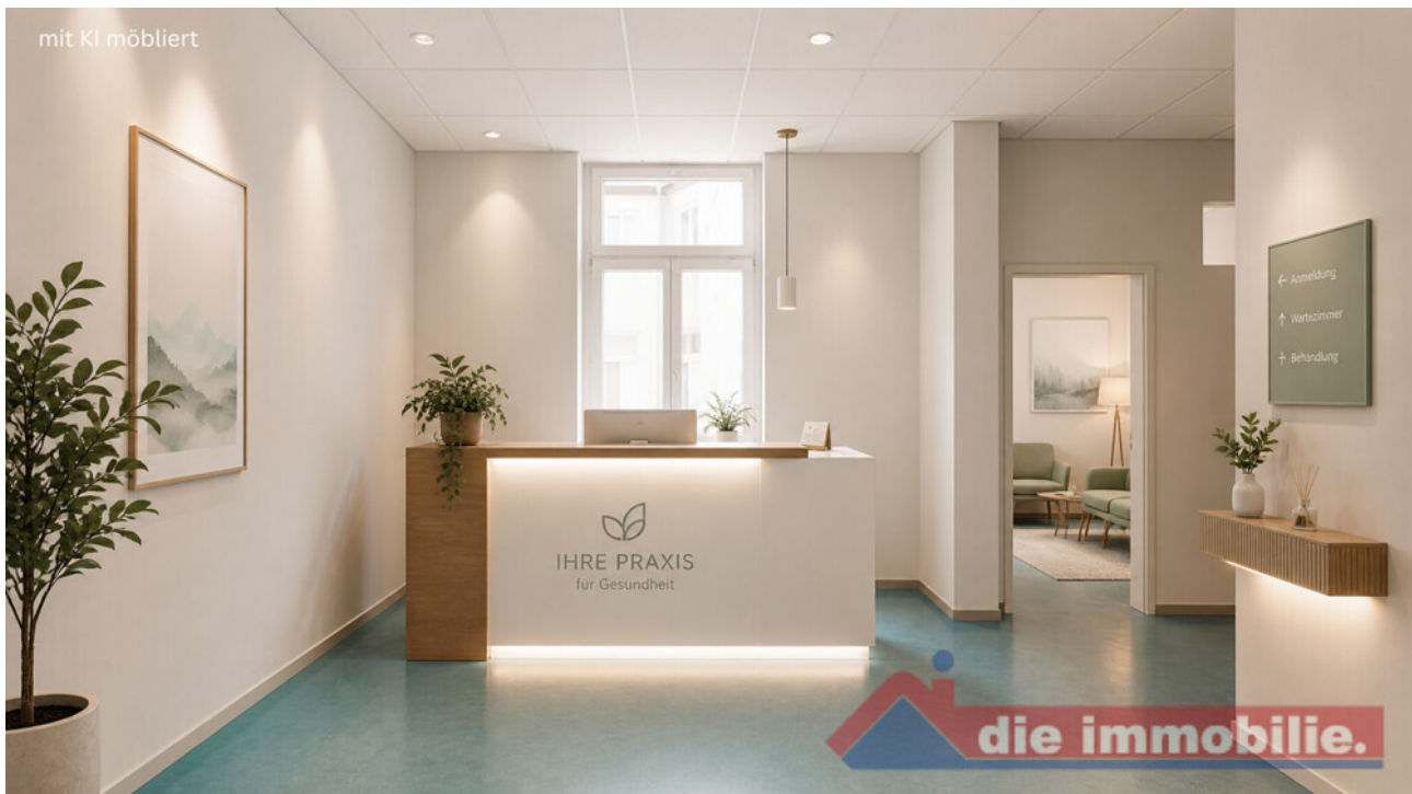
Empfang mit KI möbliert