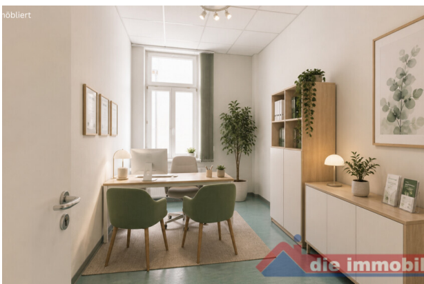
Büro mit KI möbliert