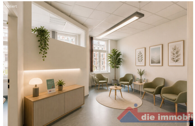
Wartezimmer mit KI möbliert