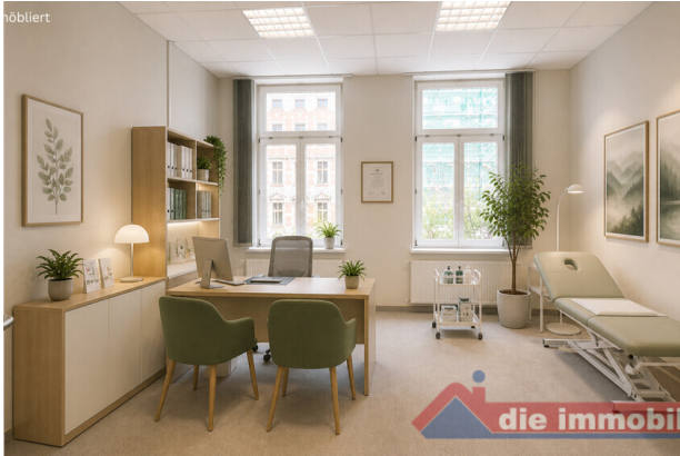
Sprechzimmer1 mit KI möbliert