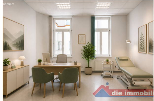
Sprechzimmer2 mit KI möbliert