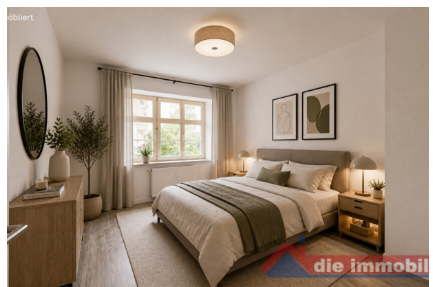
Schlafzimmer mit KI möbliert