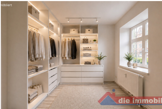
Ankleidezimmer mit KI möbliert