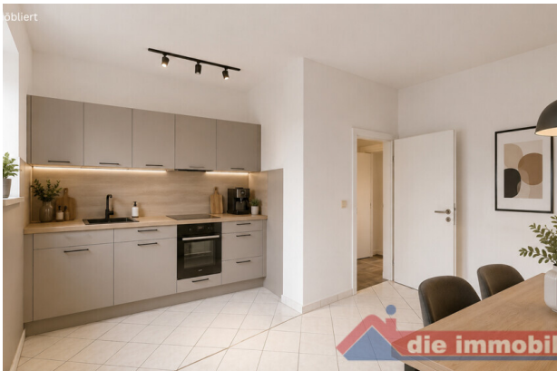
Küche mit KI möbliert