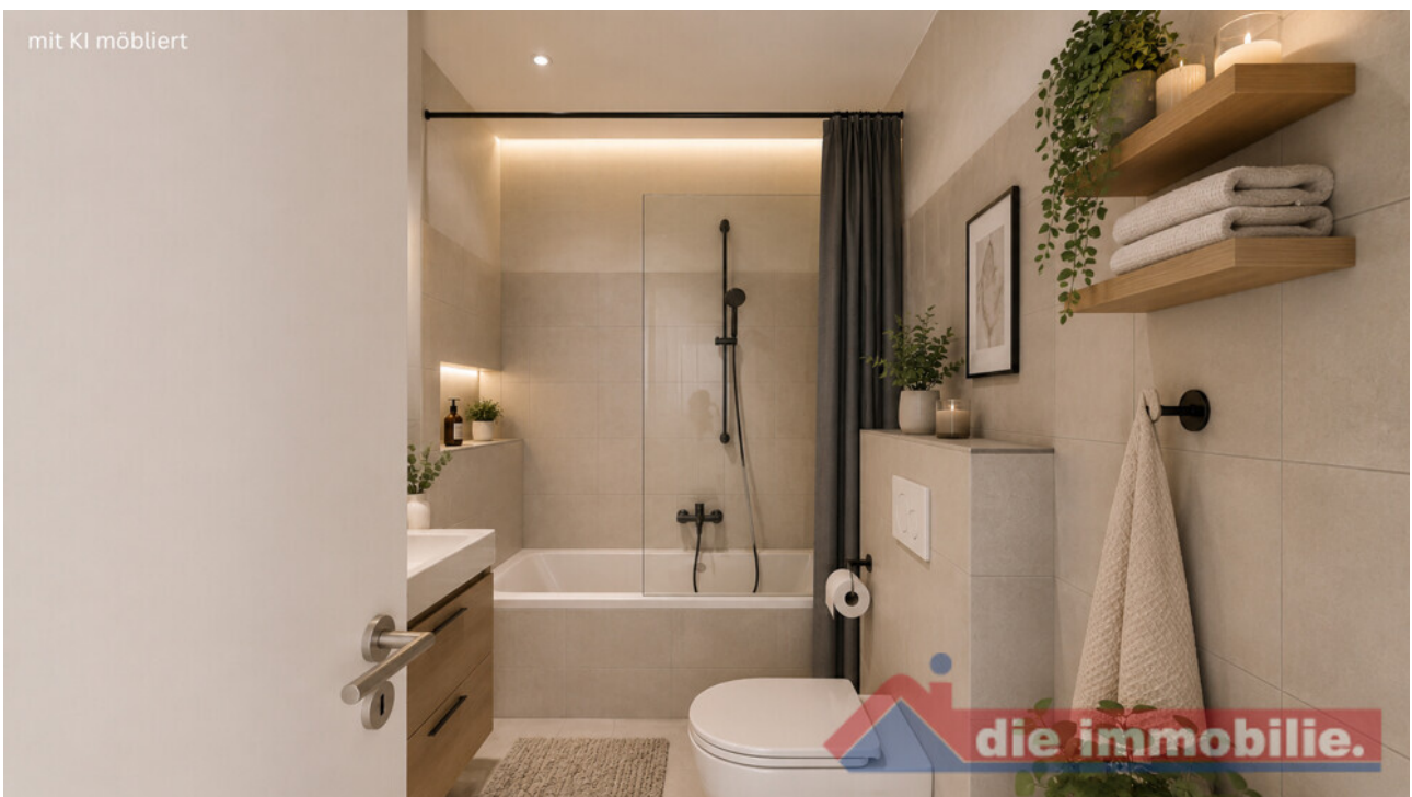
Bad mit KI möbliert