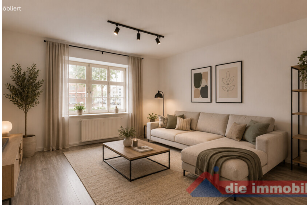
Wohnzimmer mit KI möbliert