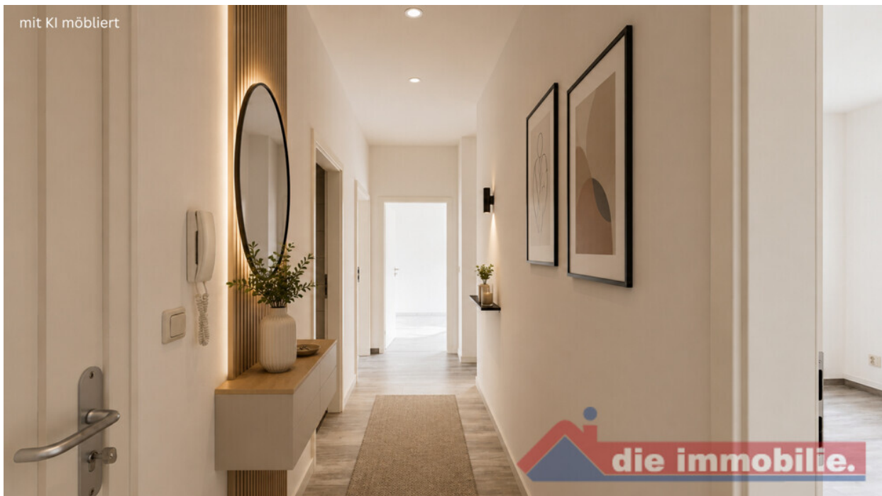
Flur mit KI möbliert