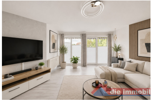
Wohnzimmer_mit KI möbliert