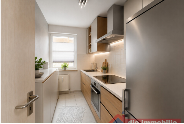
Küche_mit KI möbliert