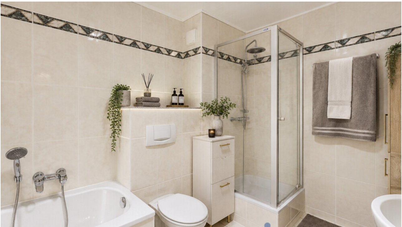
Badezimmer_mit KI möbliert