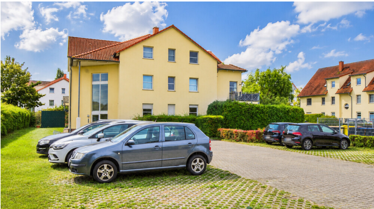
Parkplatz vor dem Haus