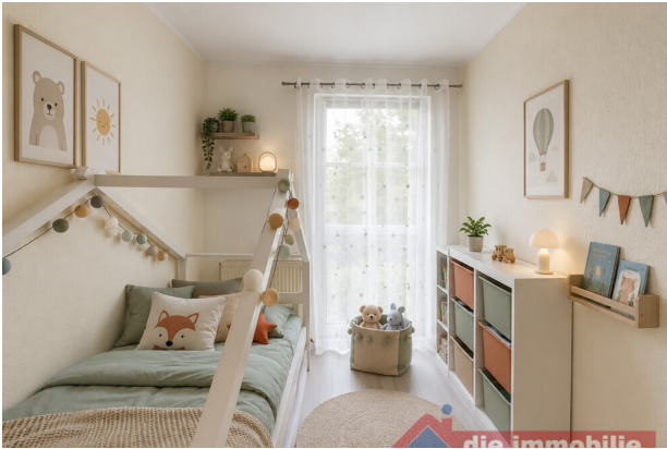
Kinderzimmer_mit KI möbliert