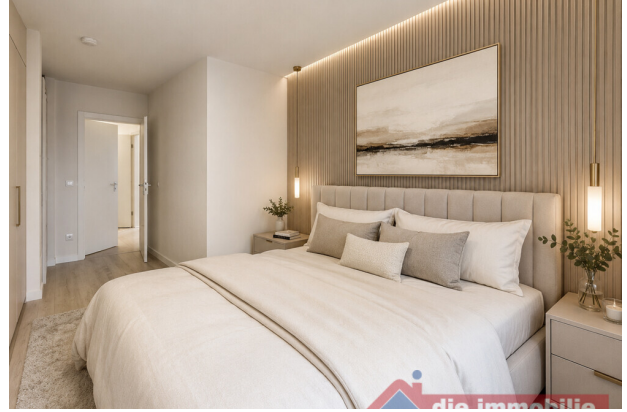
Schlafzimmer_mit KI möbliert