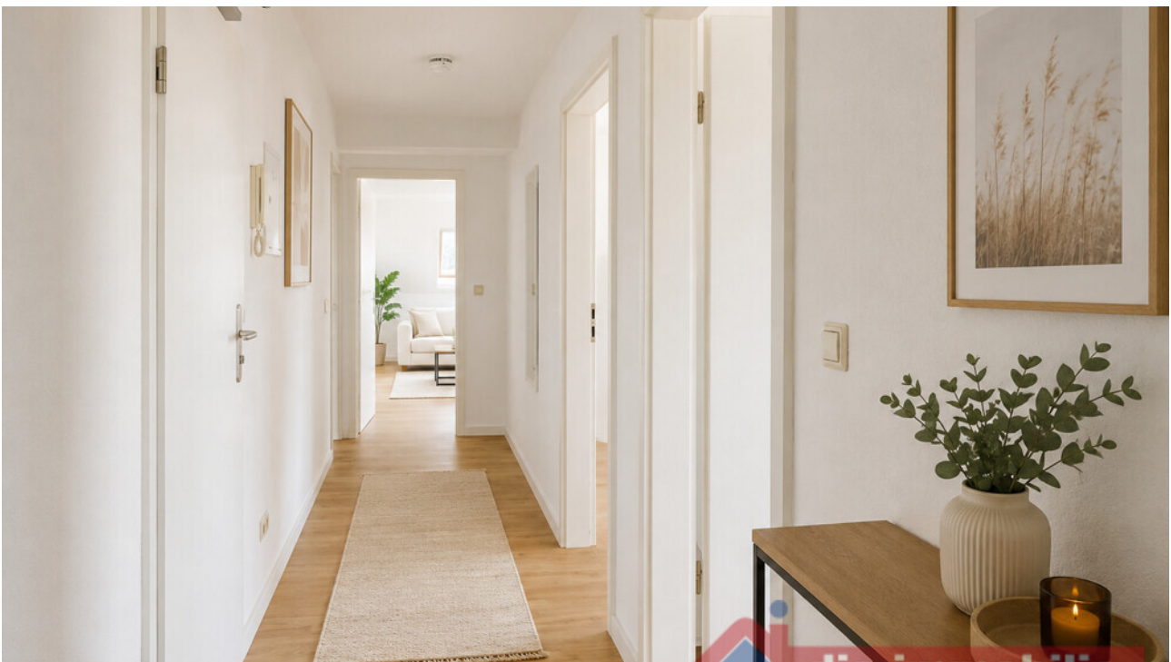
Einrichtungsvorschlag: freundlicher Eingangsbereich mit wohnlicher Atmosphäre