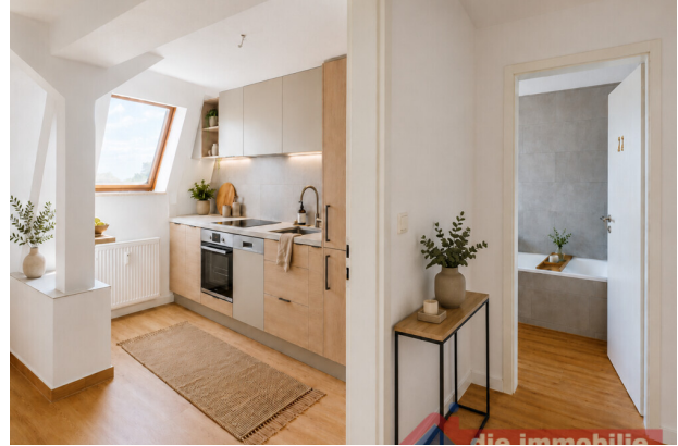
Einrichtungsvorschlag: moderne Küchenlösung mit Stauraum und Arbeitsfläche