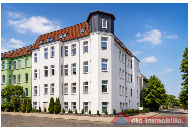
Außenansicht des gepflegten Mehrfamilienhauses