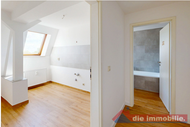
Küche im modernisierten Zustand