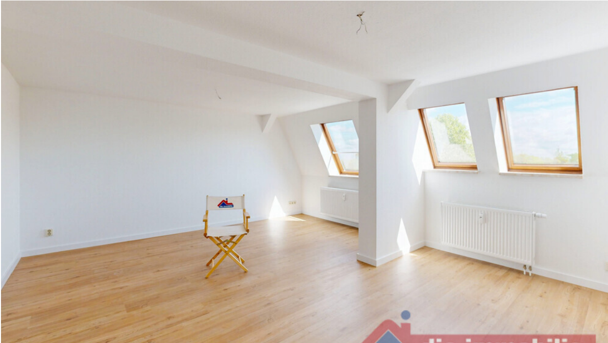
Heller Wohnbereich mit Dachfenstern und moderner Bodenoptik