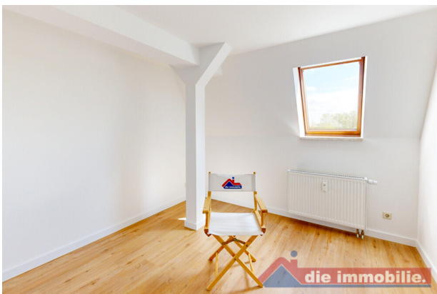
Helles Schlafzimmer mit Dachfenster