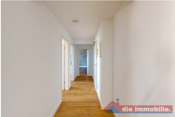
Flur mit Zugang zu den einzelnen Wohnräumen