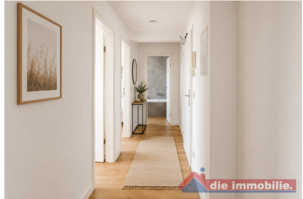
Einrichtungsvorschlag: aufgewerteter Flurbereich mit Dekoration