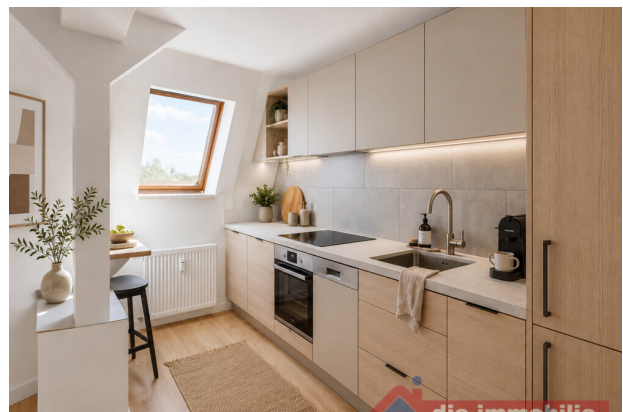
Einrichtungsvorschlag: helle Küche mit moderner Ausstattung