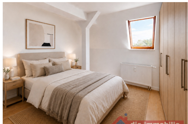
Einrichtungsvorschlag: gemütliches Schlafzimmer unter dem Dach