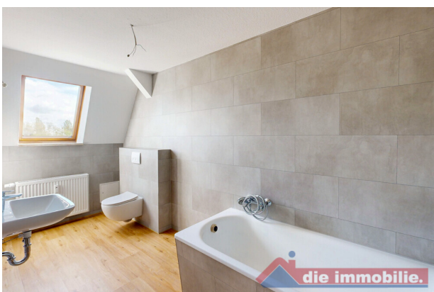
Tageslichtbad mit Badewanne