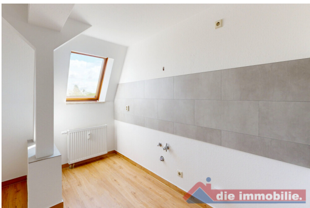
Küchenbereich mit Anschlüssen und moderner Wandgestaltung