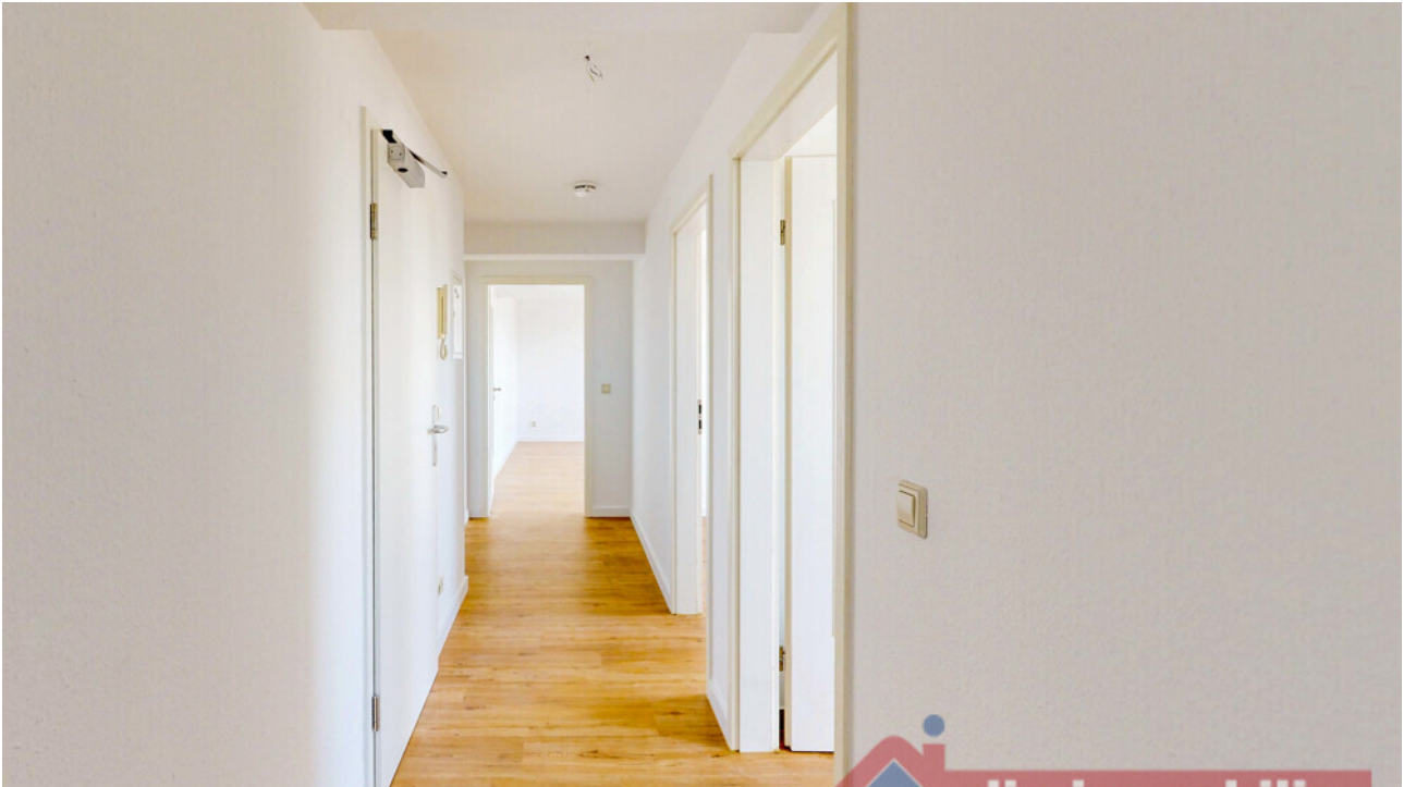
Blick durch den Flur der Wohnung