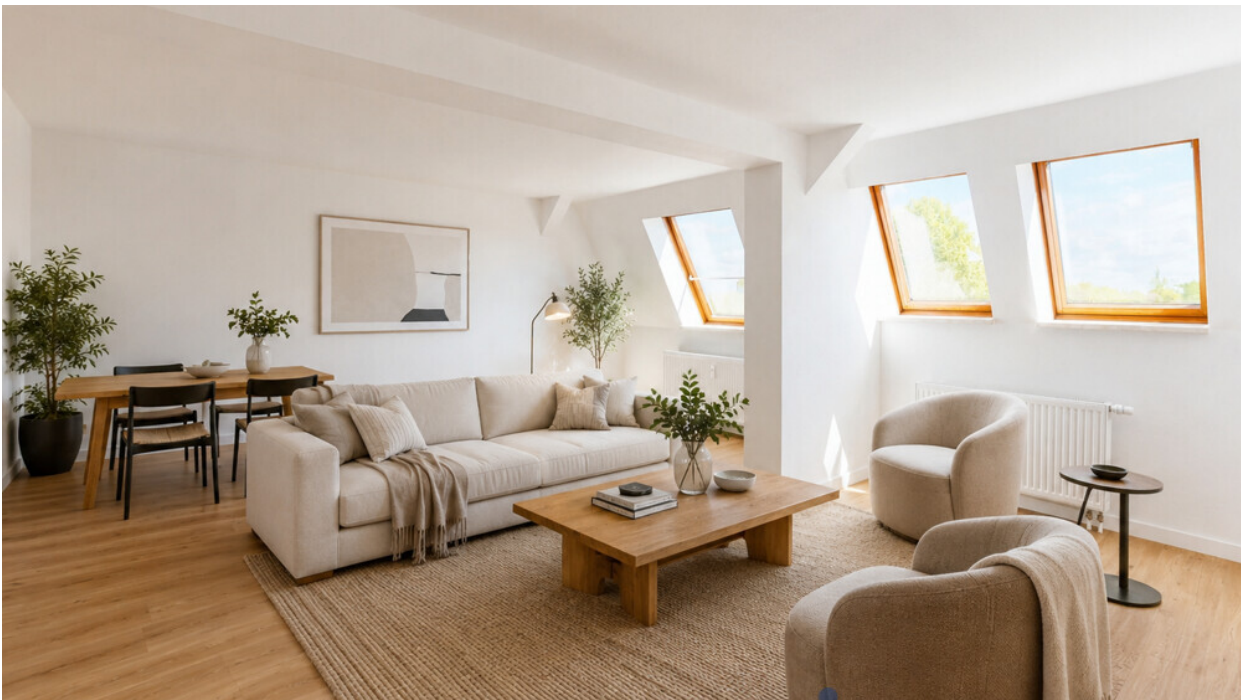
Einrichtungsvorschlag: gemütlicher Wohn- und Essbereich