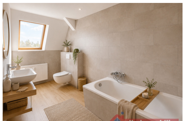
Einrichtungsvorschlag: helles Badezimmer mit wohnlichem Charakter