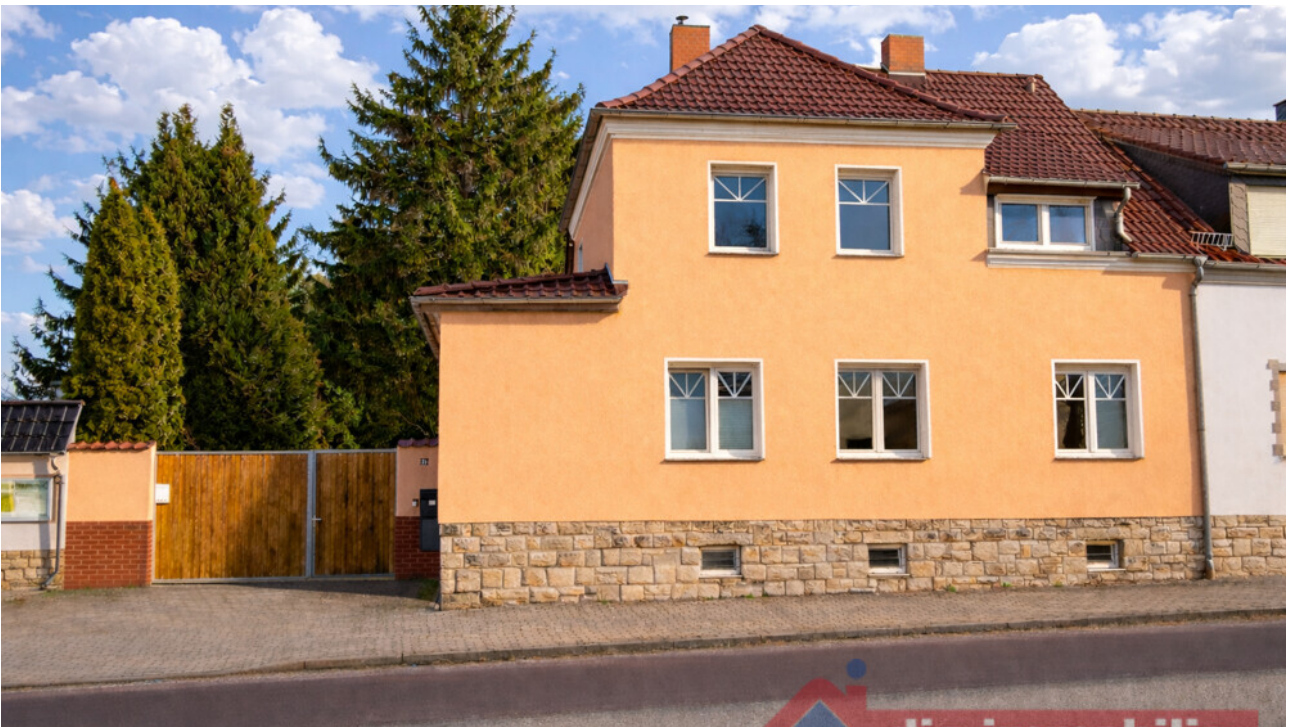
Straßenansicht der Doppelhaushälfte