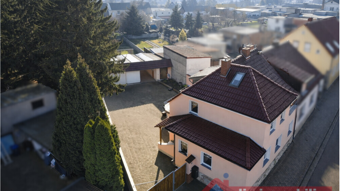
Luftaufnahme mit Hof und Nebengebäude