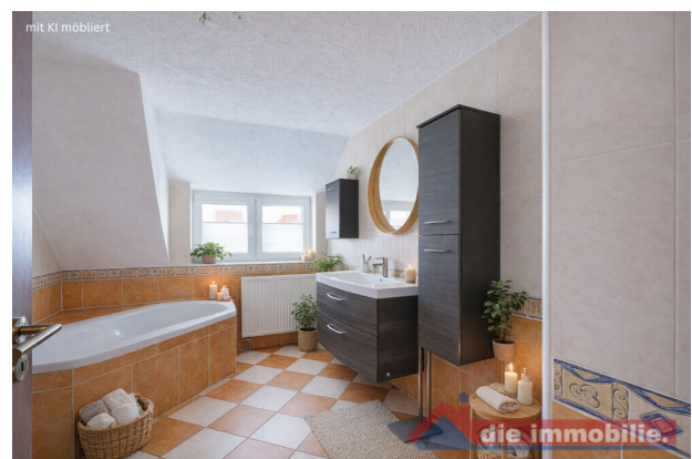
Familienbad im Obergeschoss – virtuell möbliert