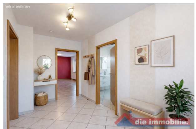
Diele – virtuell möbliert