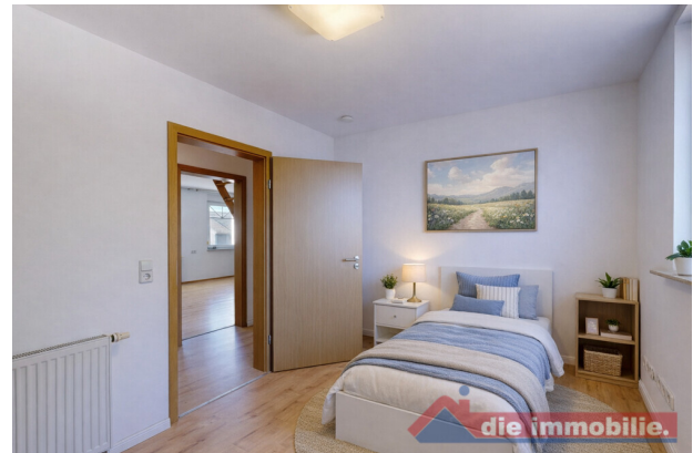
Kinderzimmer – virtuell möbliert