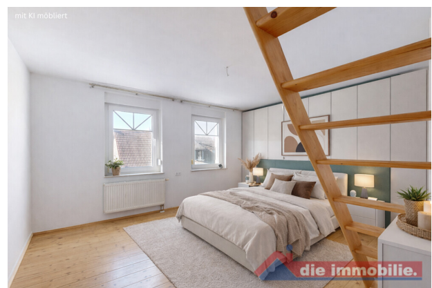
Schlafzimmer – virtuell möbliert