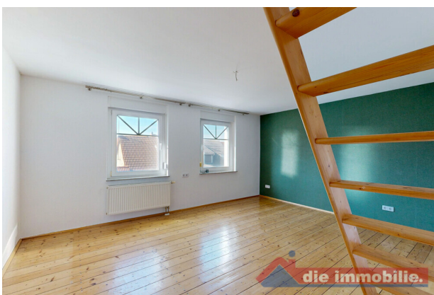
Schlafzimmer mit guter Raumhöhe