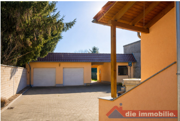
Doppelgarage mit Hofzufahrt