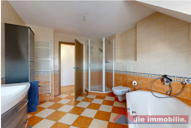
Familienbad mit Dusche und Badewanne