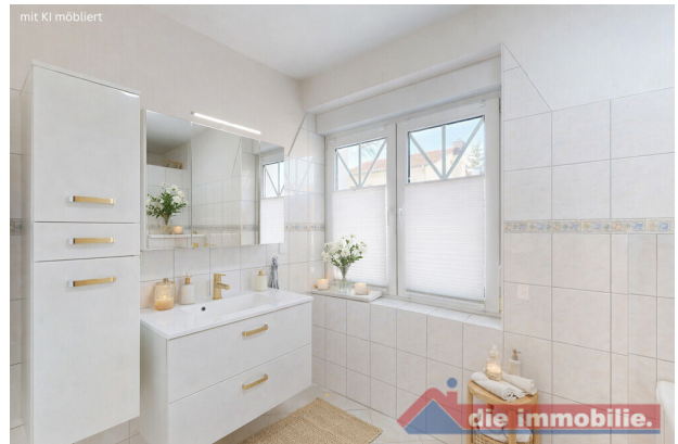
Bad im Erdgeschoss – virtuell möbliert