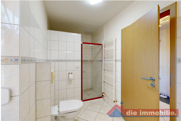
Badezimmer im Erdgeschoss