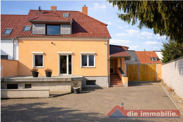
Innenhof mit Zugang zum Haus