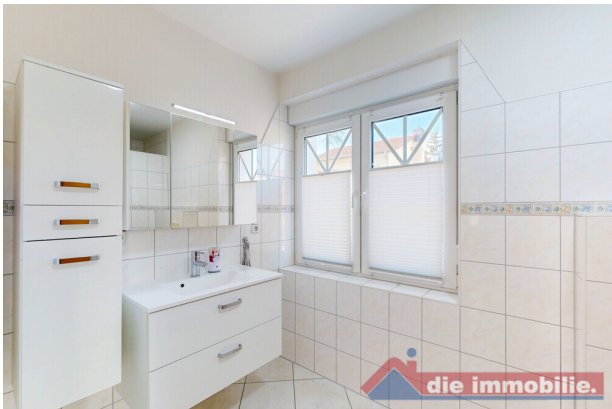
Bad im Erdgeschoss mit Tageslicht