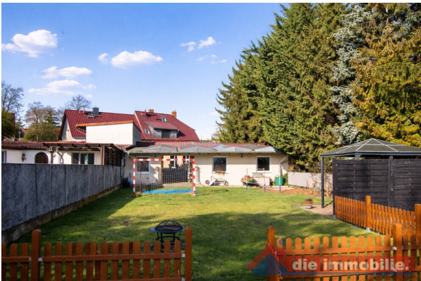
Garten mit viel Platz für Freizeit und Familie