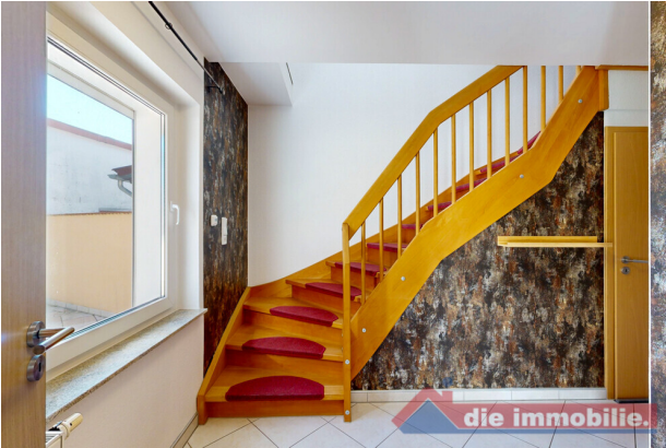
Treppe ins Obergeschoss