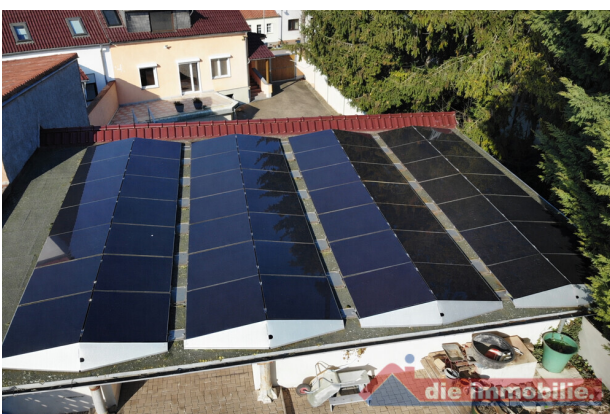
Photovoltaikanlage auf dem Nebengebäude