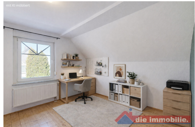
Kinderzimmer – virtuell möbliert