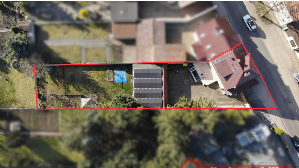
Grundstück aus der Vogelperspektive