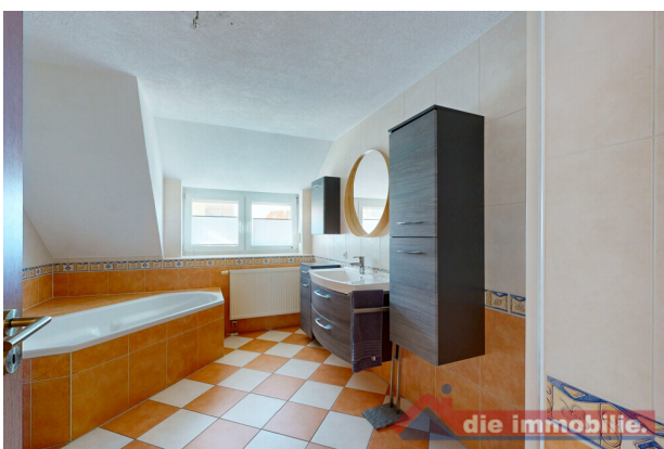
Familienbad im Obergeschoss