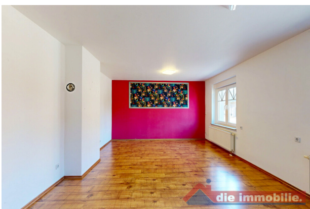
Wohnzimmer mit großzügigem Schnitt