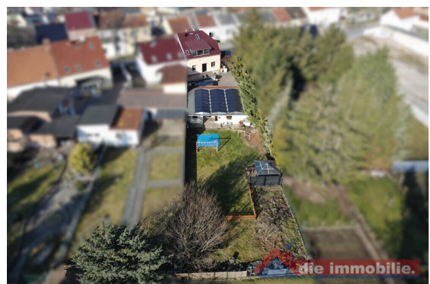
Luftaufnahme von Garten und Nebengebäude