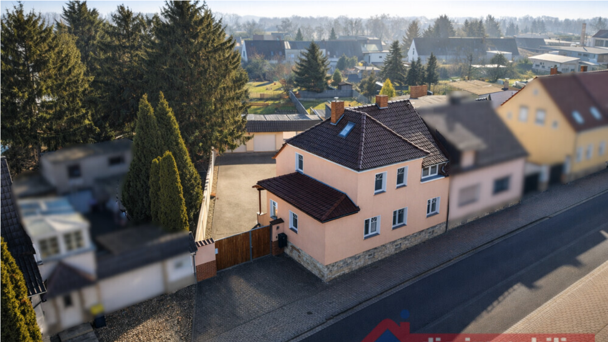
Luftaufnahme der Immobilie