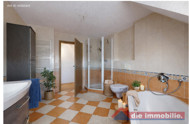
Familienbad – virtuell möbliert