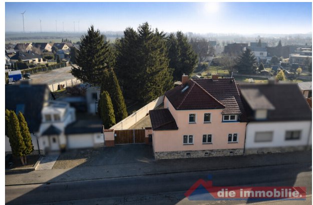
Luftaufnahme der Straßen- und Hofseite