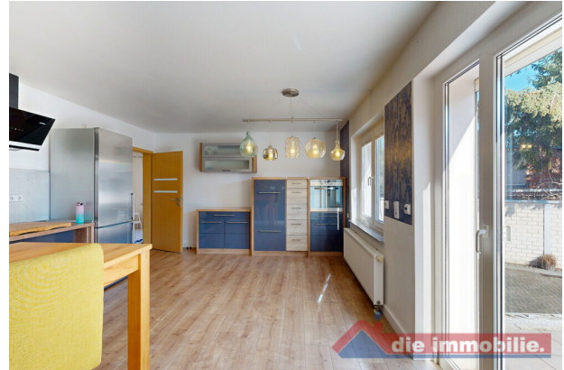
Großzügige Wohnküche mit Terrassenzugang