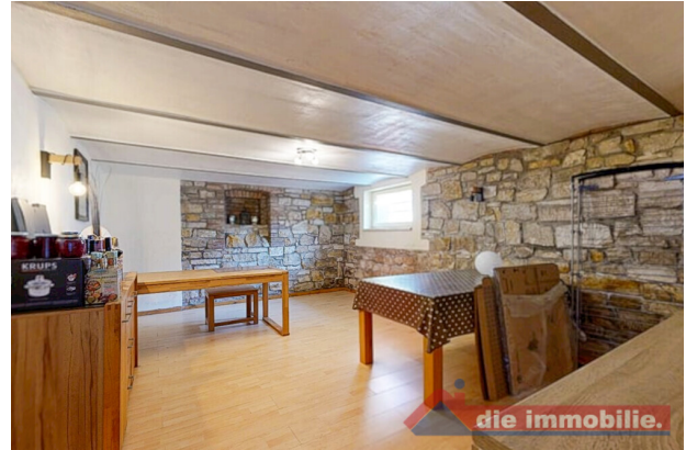
Partyraum im Keller