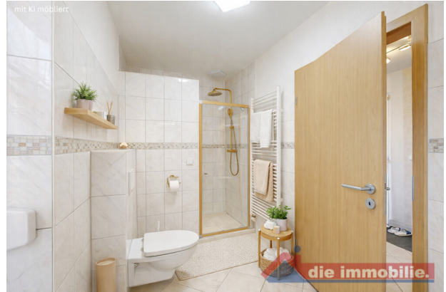
Badezimmer im Erdgeschoss – virtuell möbliert