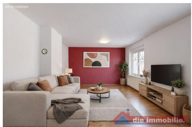
Wohnzimmer – virtuell möbliert