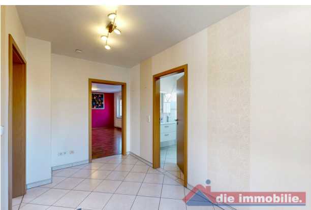
Diele im Erdgeschoss