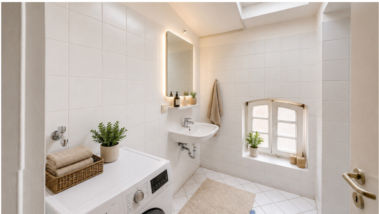
Bad mit KI möbliert