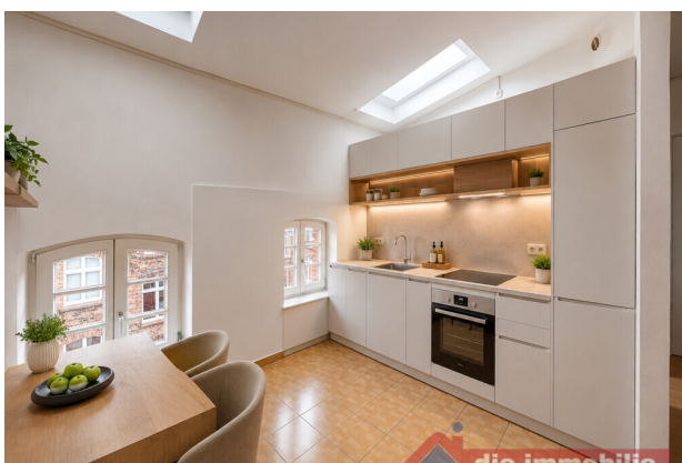
Küche mit KI möbliert