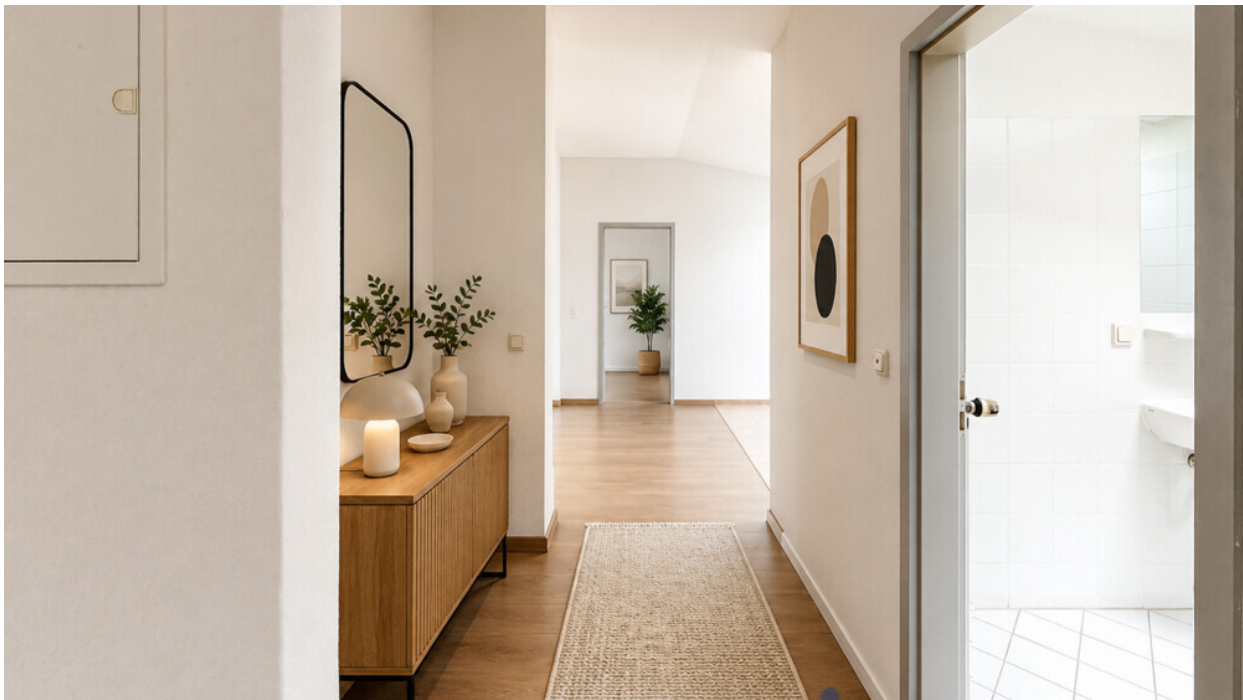
Flur mit KI möbliert