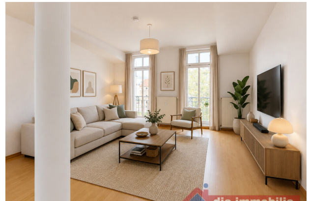
Wohnzimmer mit KI möbliert