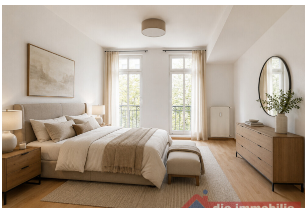
Schlafzimmer mit KI möbliert