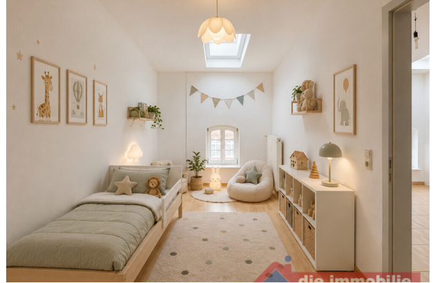
Kinderzimmer mit KI möbliert