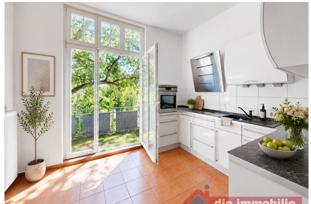
Küche mit KI möbliert