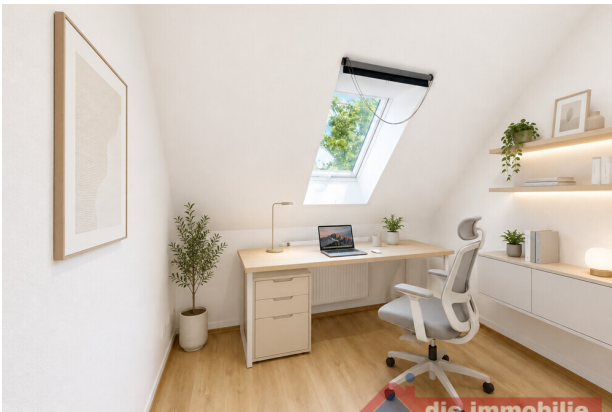
Arbeitszimmer mit KI möbliert