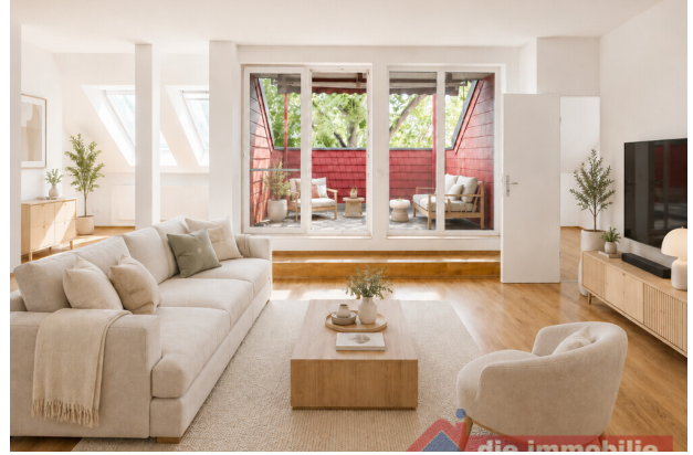
Wohnzimmer mit KI möbliert