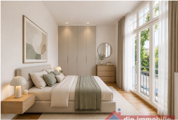
Schlafzimmer mit KI möbliert