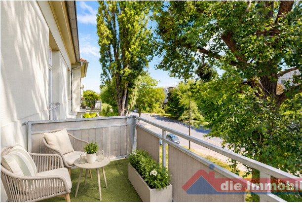
Balkon mit KI möbliert