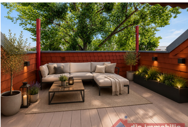
Terrasse mit KI möbliert