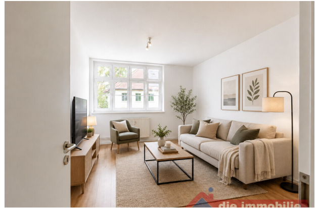
Wohnzimmer mit KI möbliert