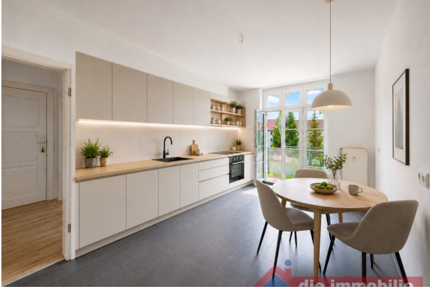
Küche mit KI möbliert