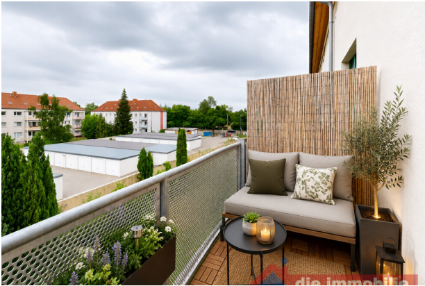
Balkon mit KI möbliert