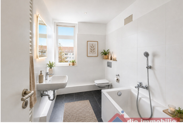
Bad mit KI möbliert