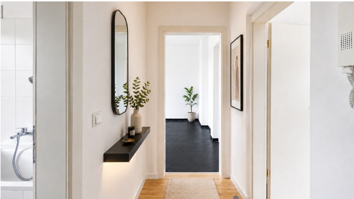
Flur mit KI möbliert