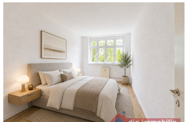
Schlafzimmer mit KI möbliert