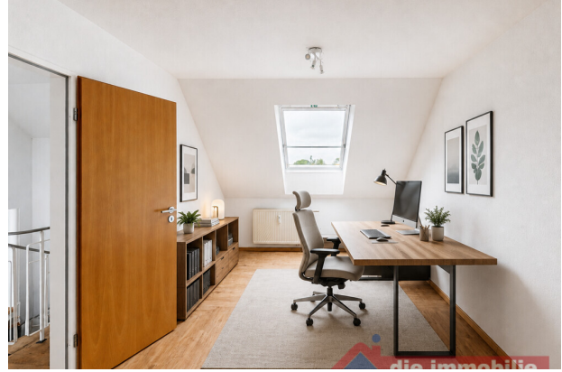
Arbeitszimmer mit Ki möbliert