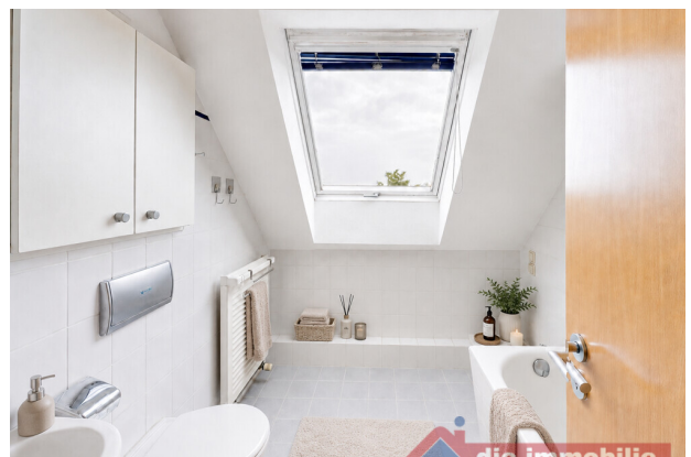
Bad mit KI möbliert