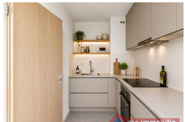
Küche mit KI möbliert