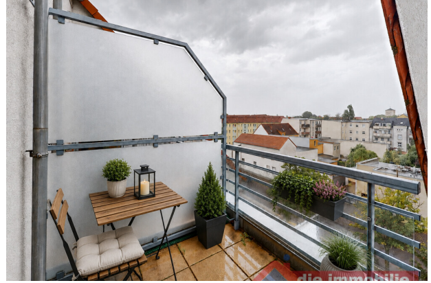
Balko mit KI möbliert