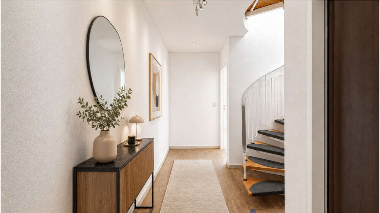
Flur mit KI möbliert