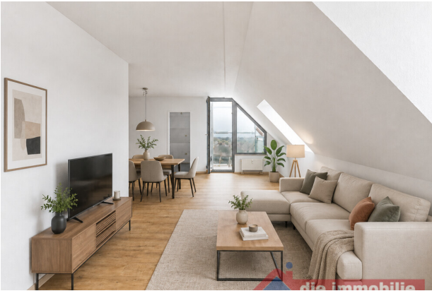
Wohnzimmer mit KI möbliert