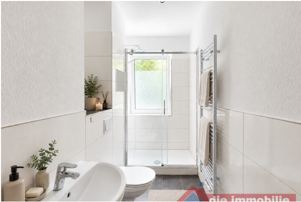
Bad mit KI möbliert