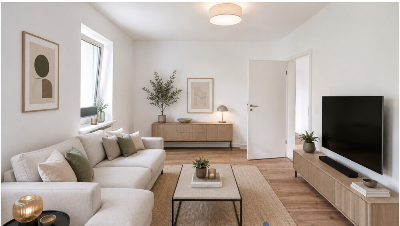
Wohnzimmer mit KI möbliert