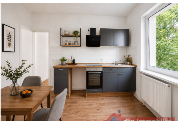
Küche_2 mit KI möbliert