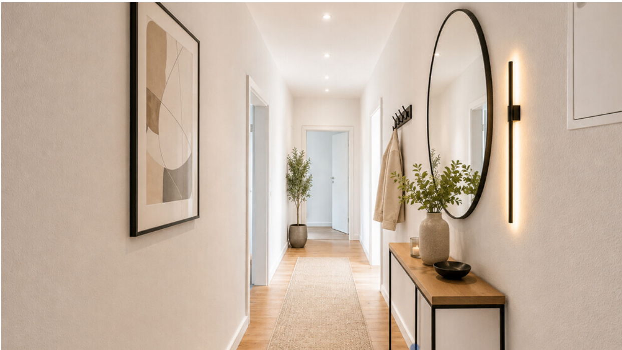
Flur mit KI möbliert