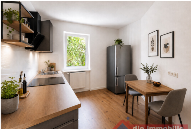
Küche mit KI möbliert