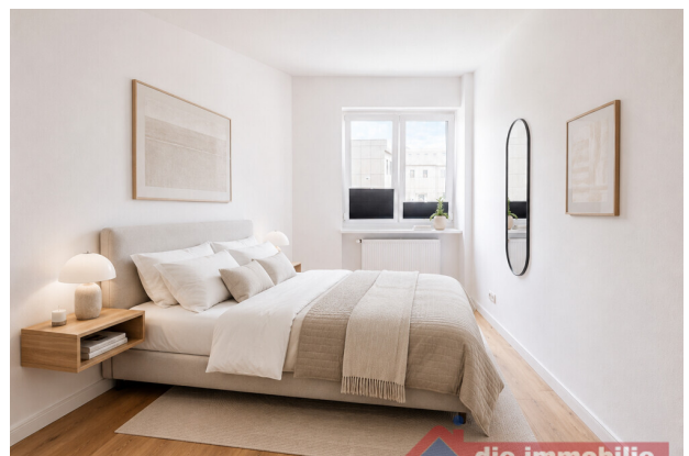
Schlafzimmer mit KI möbliert