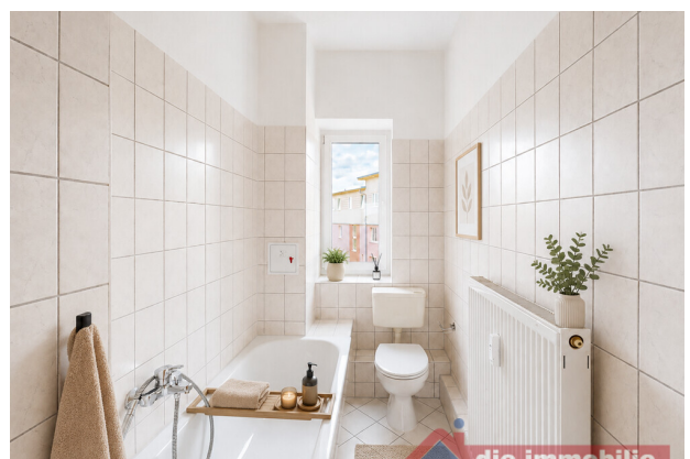
Bad mit KI möbliert