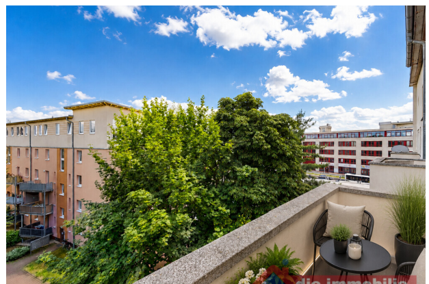
Balkon mit KI möbliert