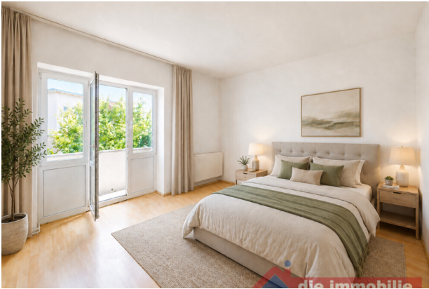
Schlafzimmer mit KI möbliert