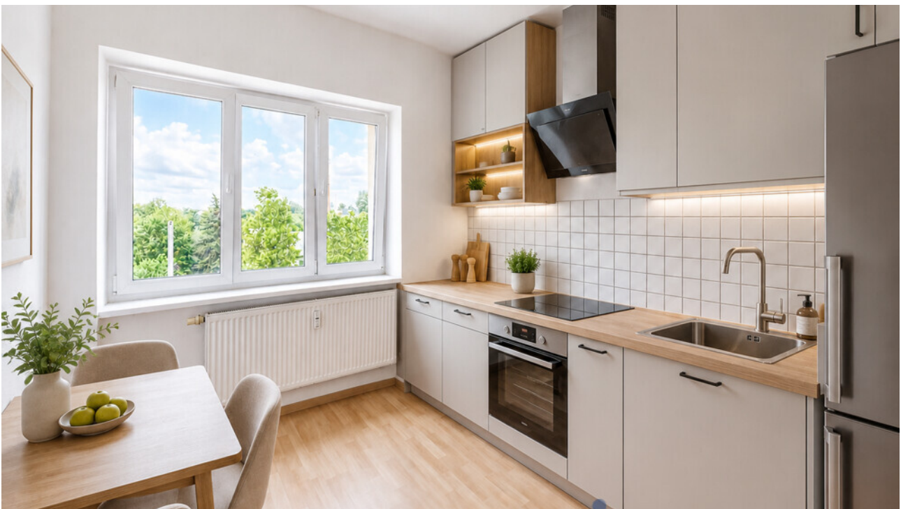
Küche mit KI möbliert