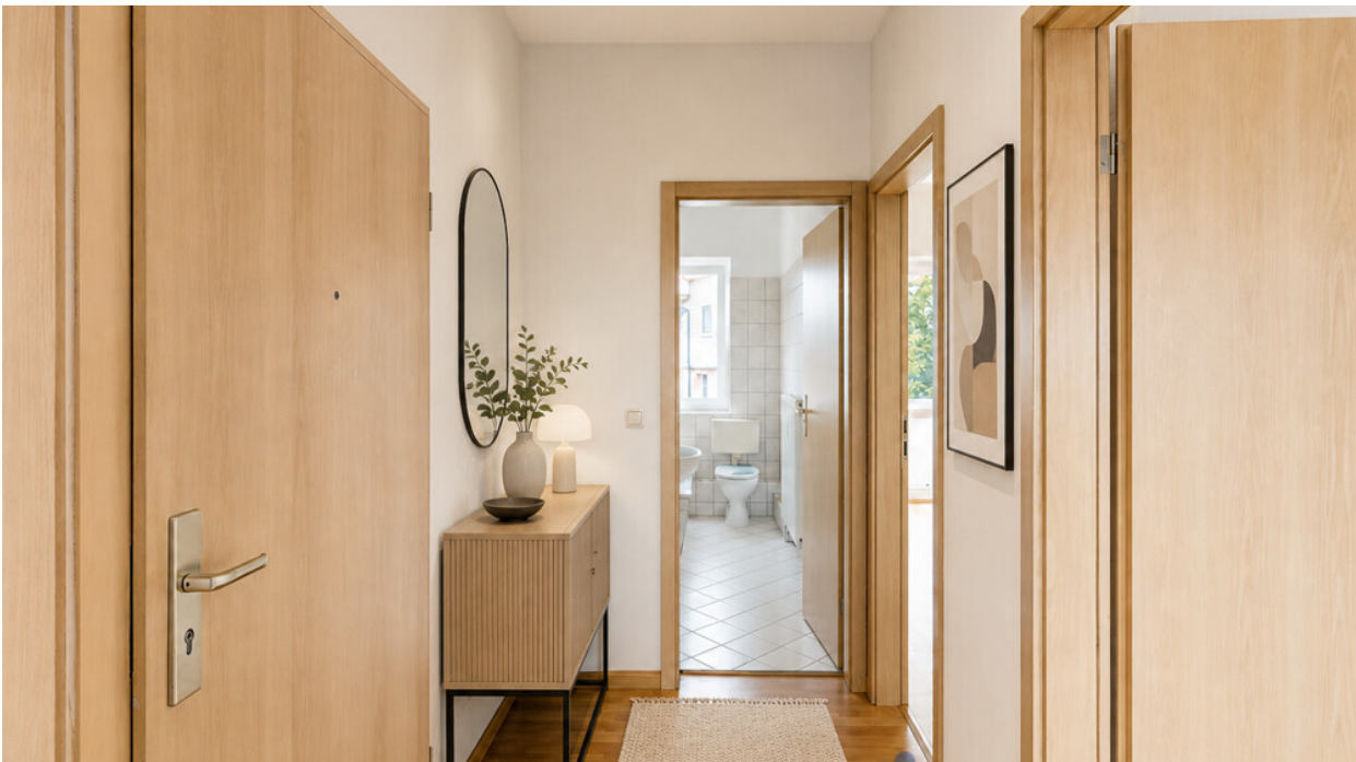
Flur mit KI möbliert