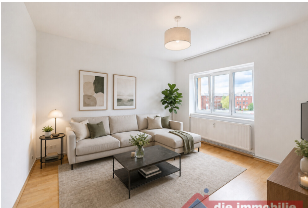
Wohnzimmer mit KI möbliert