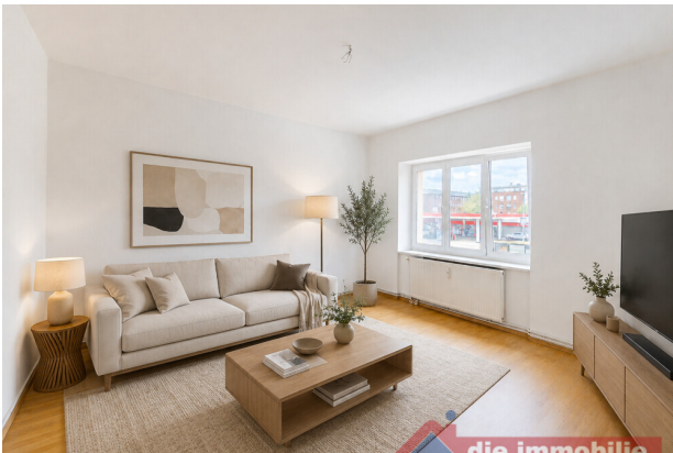
Wohnzimmer mit KI möbliert