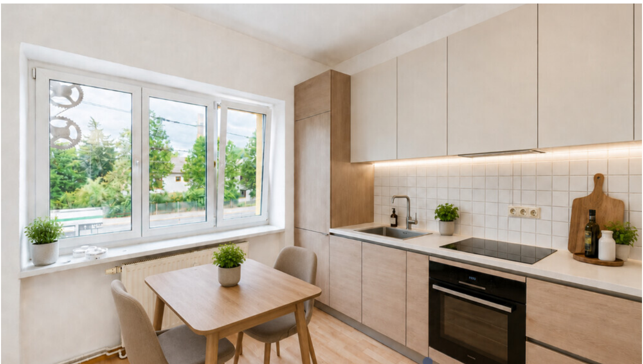
Küche mit KI möbliert