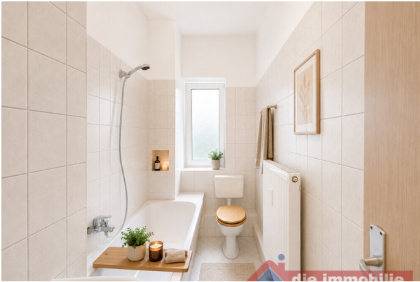
Bad mit KI möbliert