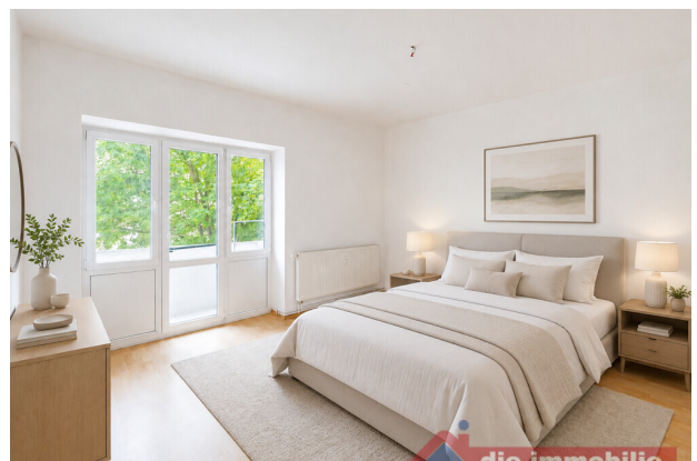
Schlafzimmer mit KI möbliert