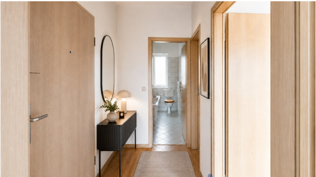
Flur mit KI möbliert