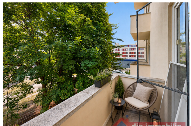
Balkon mit KI möbliert